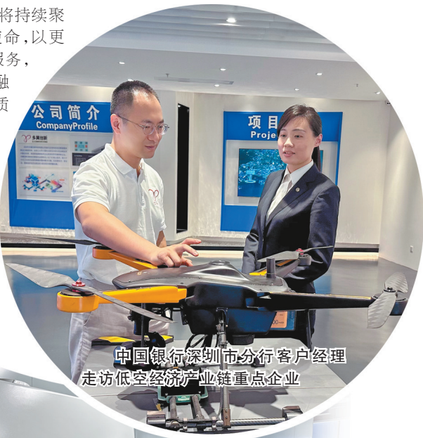
中国银行深圳市分行客户经理走访低空经济产业链重点企业