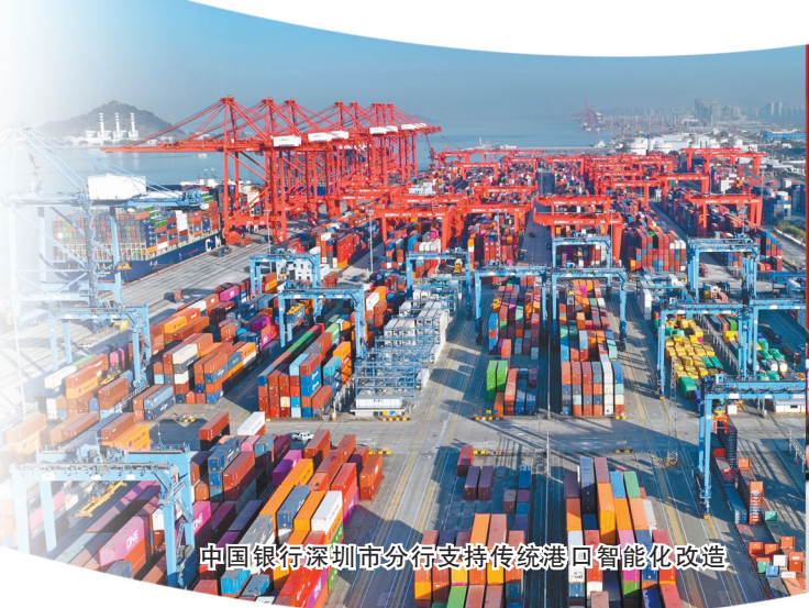
中国银行深圳市分行支持传统港口智能化改造