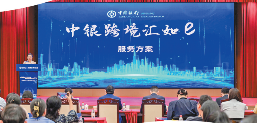
中国银行深圳市分行举办“中银跨境汇如e”服务方案宣讲活动