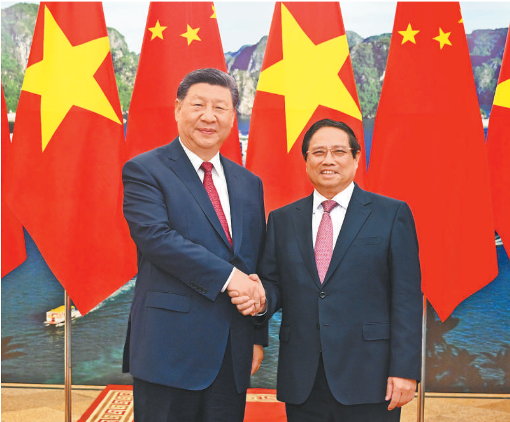
4月14日晚，国家主席习近平在越共中央驻地会见越南总理范明政。

习近平总书记在署名文章中指出，中国正在以中国式现代化全面推进强国建设、民族复兴伟业，越南即将开启民族发展新纪元，朝着建党建国“两个一百年”奋斗目标迈进。中国始终将越南视为周边外交优先方向。我们要全面深化中越命运共同体建设，为亚洲乃至世界和平稳定和发展繁荣作出积极贡献。 当前，中越深化发展战略对接，落实好两国政府关于共建“一带一路”与“两廊一圈”框架对接的合作规划，打造更多经济、技术合作平台。越南驻华大使范清平表示，中国连续20多年保持越南最大贸易伙伴地位，越南持续多年成为中国在东盟第一大贸易伙伴，并在2024年成为中国全球第四大贸易伙伴。 习近平总书记指出，中方愿同越方推进越南北部3条标准轨铁路项目合作，建设智慧口岸。越南铁路项目管理委员