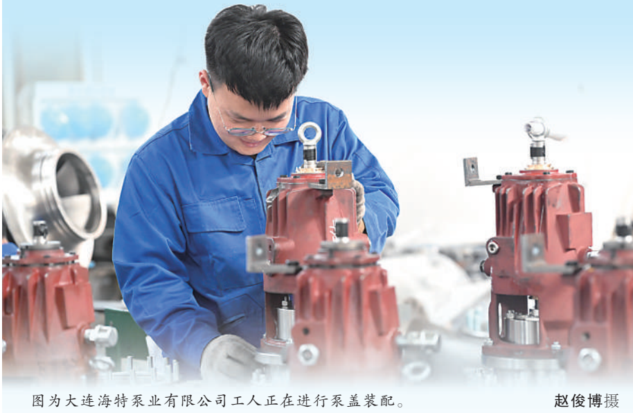
图为大连海特泵业有限公司工人正在进行泵盖装配。