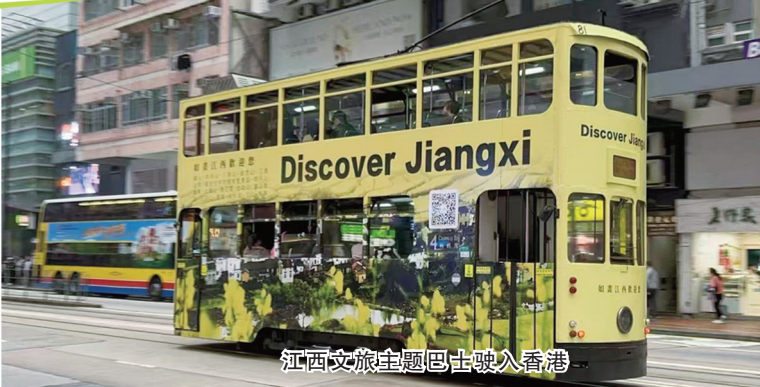
江西文旅主题巴士驶入香港