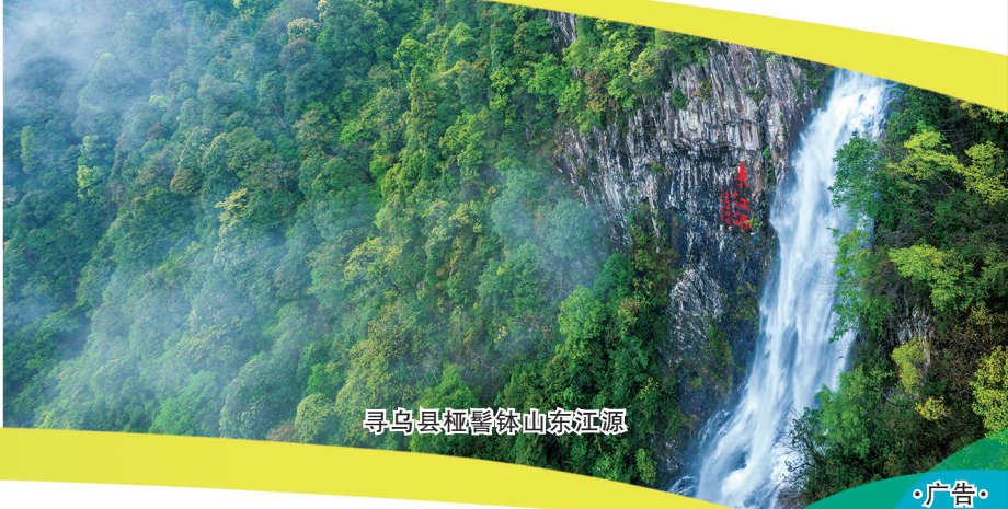
寻乌县红井镇山泉江源