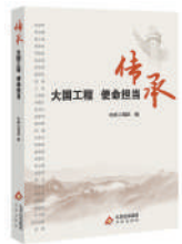
《传承：大国工程 使命担当》：中国工程院编；天津出版社出版。