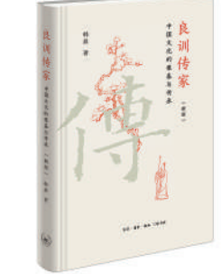
《良训传家：中国文化的根基与传承》：韩昇著，生活·读书·新知三联书店出版。