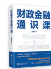
《财政金融通识课》：王东京著；中国财政经济出版社出版。

本书讲述了30位杰出的中国工程院院士的人生故事。他们大多是新中国科技事业开创过程中的关键人物,为推动工程科技事业发展作出了巨大贡献。