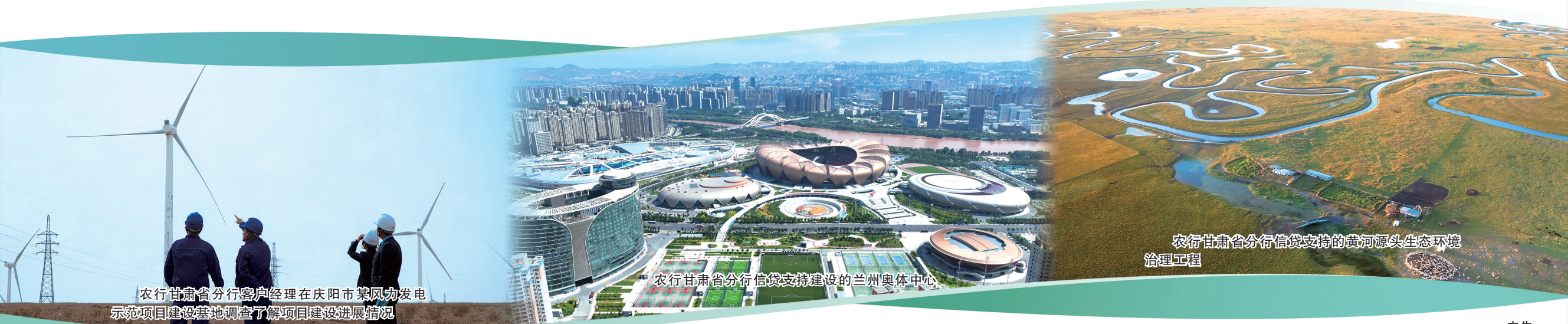
农行甘肃省分行信贷支持的黄河源头生态环境治理工程