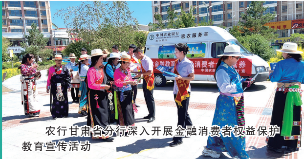
农行甘肃省分行深入开展金融消费者权益保护教育宣传活动

农行甘肃省分行深入践行金融工作的政治性、人民性，全力做好稳经济惠民生金融服务。打通普惠金融服务“最后一公里”。推动“普惠e站”与政务服务平台互联互通，创新推出“结算e贷”“电费e贷”等特色产品，深入落实支持小微企业融资协调工作机制，明确8项重点工作和10项配套政策，通过“千企万户大走访”活动精准对接需求，为小微企业提供高效金融服务。激发消费市场活力。通过农行掌银、信用卡等渠道开展多样化消费满减补贴活动，助力消费品以旧换新政策落地。开展“情暖新市民”系列活动，走近农民工、外卖骑手、快递小哥等群体，提供个性化金融服务。将特殊关怀投向老年群体，打造社区助餐养老共建金融服务点，老人刷脸即可享受政府补贴，提升老年群体的获得