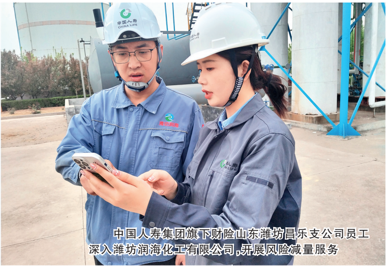
中国人寿集团旗下财险山东潍坊昌乐支公司员工 深入潍坊润海化工有限公司，开展风险减量服务

中国人寿集团成员单位广发银行坚持“两个毫不动摇”，树立“一视同仁”理念，积极落实支持小微企业融资协调工作机制，以金融之力赋能民营经济高质量发展。一方面，通过“千企万户大走访”活动，深入企业摸排经营情况和融资需求，持续丰富产品体系，并制定民营企业授信业务尽职免责工作指引，进一步建立健全敢贷、愿贷、能贷、会贷长效机制；另一方面，以考核为抓手，进一步提高民营企业融资业务考核权重，推动基层分支机构下沉工作重心，提升服务民营企业的内生动力。与此同时，针对不同区域、不同客户群体特点，广发银行推出“大中型客户设备采购贷”“制造业升级厂房建设贷”“科技E贷”“专精特新E贷”及“科创慧融”综合服务方案，构建科技赋能民营企业的产品体系，进一步提高服务民营企业信贷需求的专业性和精准度。截至2024年末，广发银行民营企业贷款余额增