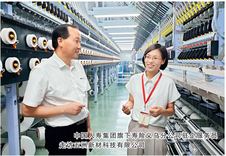
中国人寿集团旗下寿险义乌分公司驻企服务员 走访温州新材料科技有限公司

民营企业也是科技创新发展的重要生力军。中国人寿发挥风险管理专业优势，为民营企业深耕科技沃土提供坚实后盾，集团旗下财险公司成立近70个科技保险支公司及专营团队，着力发展首台(套)技术装备、首批