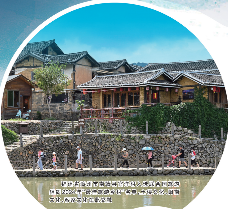
福建省漳州市南靖县官洋村入选联合国旅游组织2024年“最佳旅游乡村”名单，土楼文化、闽南文化、客家文化在此交融