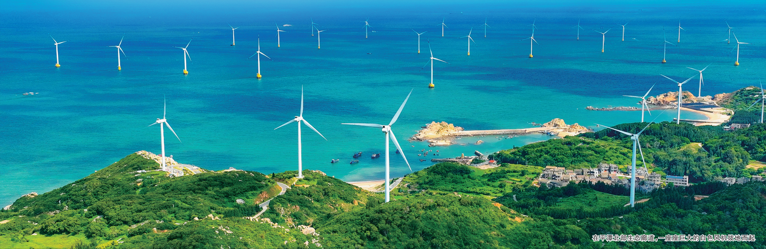
在平潭北部生态廊道，一座座巨大的白色风机拔地而起