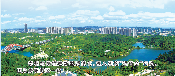
贵州加快推进新型城镇化，深入实施“强省会”行动。图为贵阳城区一角

全面深化改革开放创新，加快服务和融入新发展格局。以经济体制改革为牵引进一步全面深化改革，稳妥推进省属国有企业改革重组，推进要素市场化配置改革，建立公共数据授权运营机制。深入推进产