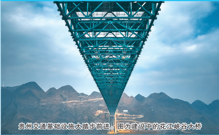
贵州交通基础设施大踏步前进。图为建设中的花江峡谷大桥