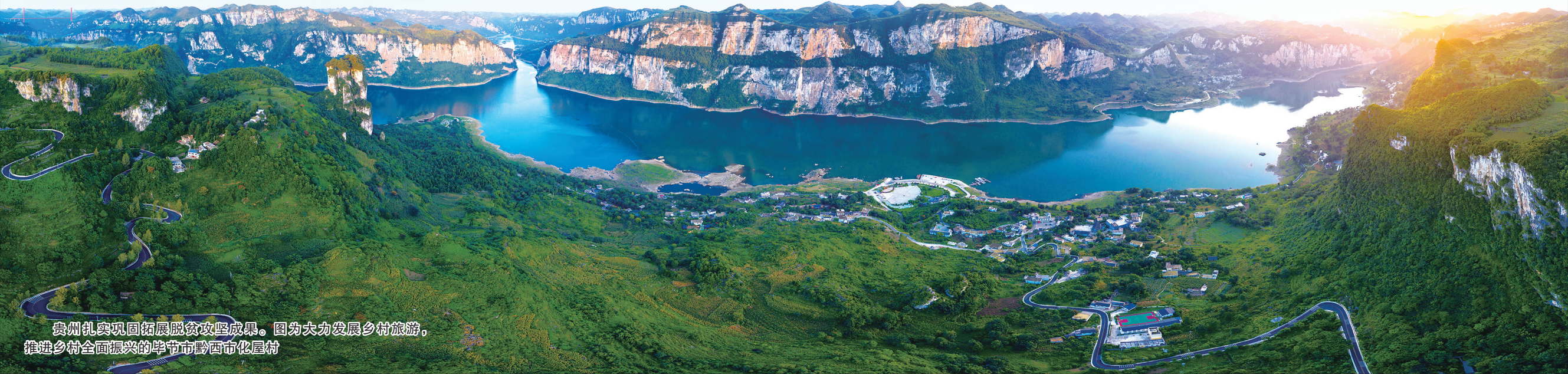
贵州扎实巩固拓展脱贫攻坚成果。图为大力发展乡村旅游，推进乡村全面振兴的毕节市黔西市化屋村