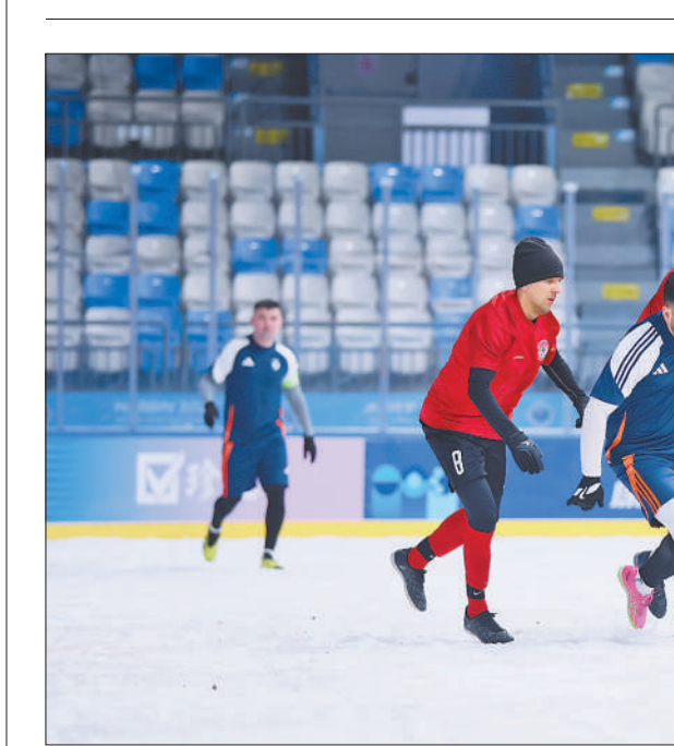
2025第二届上海合作组织雪地足球赛3月1日在哈尔滨开赛。本届比赛有来自印度、伊朗、哈萨克斯坦、中国、吉尔吉斯斯坦、俄罗斯、塔吉克斯坦、蒙古国的8支足球队参加,分为A、B两个小组,采用小组赛单循环和交叉淘汰赛制,5个比赛日共进行16场比赛。图为参赛队伍在比赛中展开角逐。

中国是上海合作组织创始成员国,始终将上海合作组织置于中国外交全局的特殊重要位置,愿同本组织伙伴团结协作,同更多认同“上海精神”的国家和国际组织携手并进,让构建人类命运共同体的前景更加光明可期。今年以来,中国担任上海合作组织轮值主席国工作加速推进。中方将主办一届友好、团结、成果丰硕的上海合作组织峰会,以及40余场机制性会议。中方还将举办上海合作组织政党