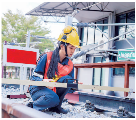
▲在泰国朱拉隆功技术学院内，轨道交通专业学生正在进行测距等实操学习。随着中泰铁路项目的推进，该学院积极与中国对口院校开展高铁技术培训等交流合作。