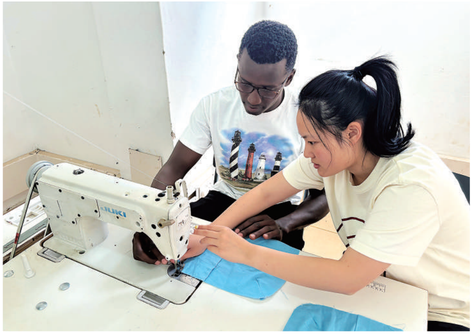
▲在肯尼亚裂谷职业技术学院，肯尼亚莫伊大学孔子学院中方教师正培训当地学生缝纫机平缝技术。