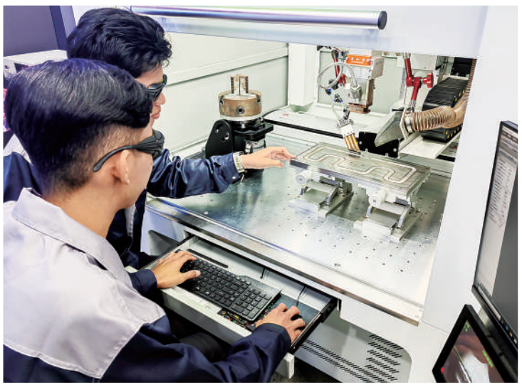
▲由南京工业职业技术大学与柬埔寨东华理事总会共建的东华应用科技大学，是中柬职业教育交流合作的重要成果。图为该校学生正在进行现代焊接技术的实操学习。