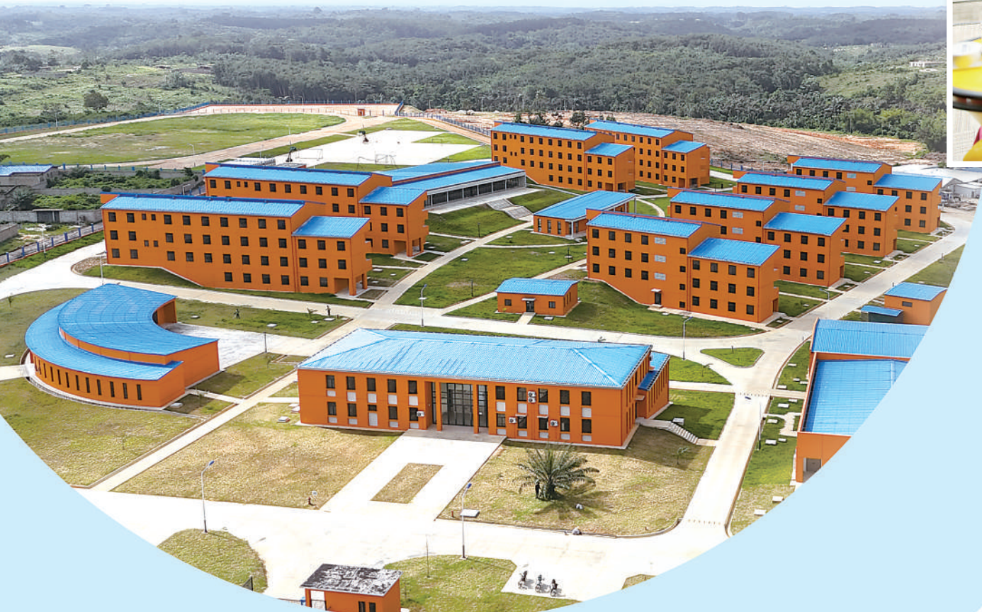
▲由中航科创成套公司承建的科特迪瓦职业培训学校项目(包含7所学校)可容纳5600名学生，预计于今年正式运营。图为科特迪瓦经济首都阿比让校区全景。