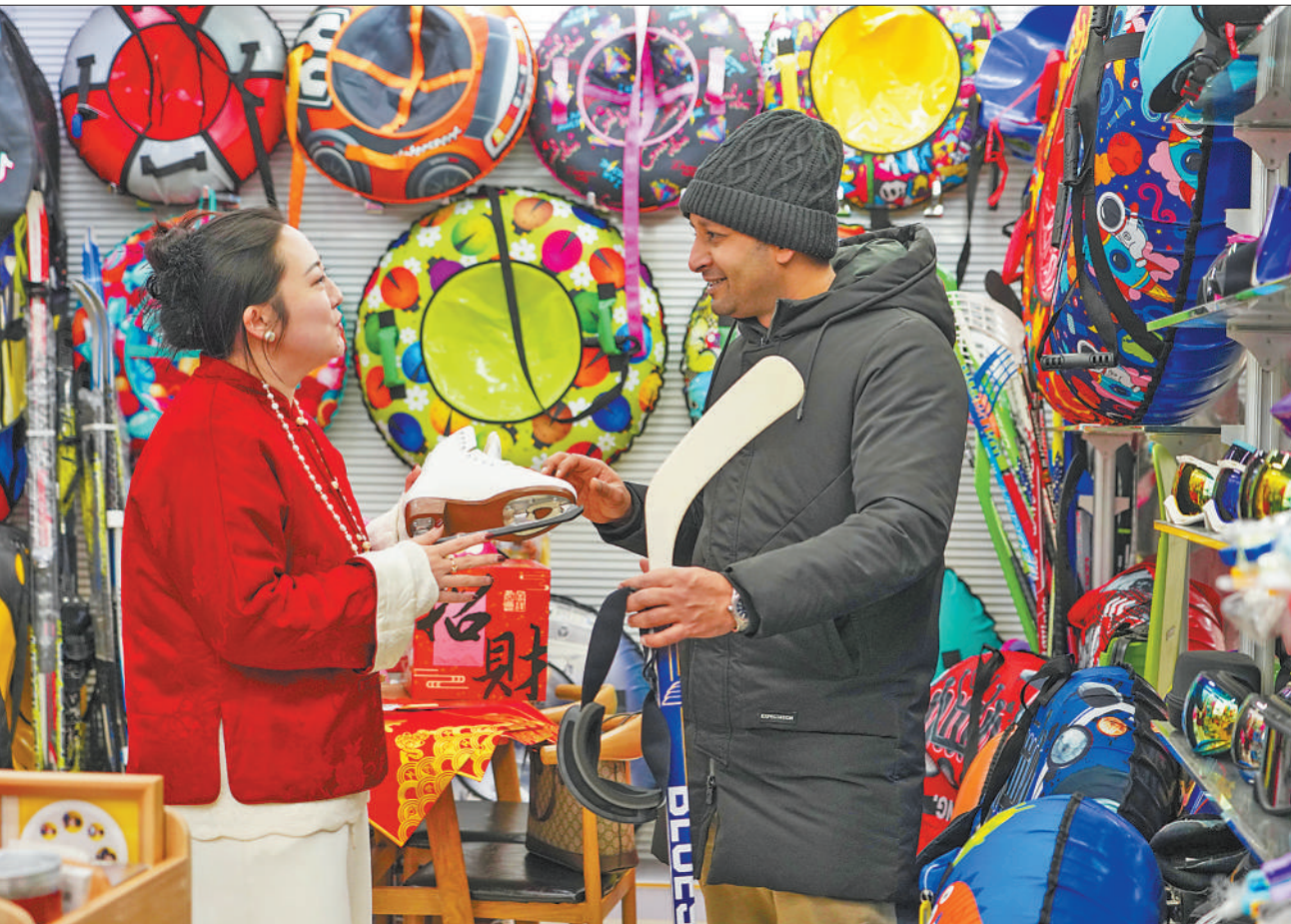
2月9日,全球最大的小商品集散中心——义乌国际商贸城开市,7.5万户商户开门上新。图为一名外商(右)和市场经营户在洽谈冰雪装备采购。

产配置为目的,开展投资黄金业务试点。试点投资黄金范围包括在上海黄金交易所主板上市或交易的黄金现货实盘合约、黄金现货延期交收合约、黄金询价即期合约、黄金询价掉期合约等。 通知提出,试点保险公司应当建立