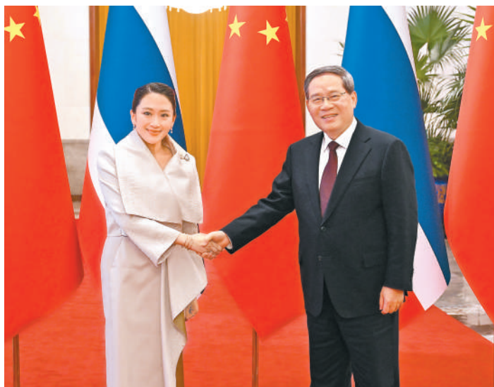
2月6日下午，国务院总理李强在北京人民大会堂同来华进行正式访问的泰国总理佩通坦举行会谈。

新华社北京2月7日电 2月6日下午，国务院总理李强在北京人民大会堂同来华进行正式访问的泰国总理佩通坦举行会谈。李强表示，今年是中泰建交50周年暨“中泰友谊金色50年”。习近平主席上午同总理女士举行会晤，为推进中泰命运共同体建设擘画新的蓝图。中方始终把发展对泰关系放在中国周边外交的优先位置，愿同泰方一道继续努力，按照两国领导人的战略引领，保持高层密切交往，巩固增进战略互信，推动中泰关系迈上新台阶，为两国人民带来更多福祉。李强指出，双方要共同办好庆祝建交50周年系列活动，促进中泰友好代代传承。中方愿同泰方推动高质量共建“一带一路”和泰国发展战略加强对接，落实好中泰战略合作共同行动计划，持续提升经贸投资、互联互通、科技创新等领域合作水平，加强文旅、青年、卫生、媒体等领域交流。中方鼓励更多中国企业赴泰投资，在新能源汽车、人工智能、数字经济等新兴领域挖掘合作潜力，更好赋能各自经济发展。双方要加强两国执法安全合作，打击跨国犯罪。当前国际形势正在经历深刻变化，面对各种不确定、不稳定因素，中泰应当更紧密团结协作，携手应对风险挑战。中方支持泰国当好澜湄合作共同主席国和亚洲合作对话主席国。(下转第四版)