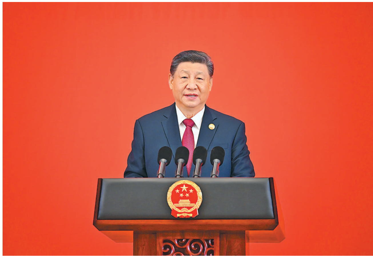
2月7日中午，国家主席习近平和夫人彭丽媛在黑龙江省哈尔滨市太阳岛宾馆举行宴会，欢迎来华出席第九届亚洲冬季运动会开幕式的国际贵宾。这是习近平发表致辞。