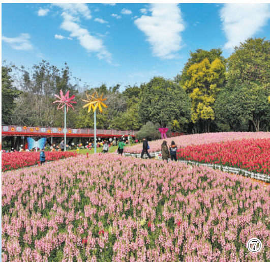
图⑦:广西壮族自治区柳州市园博园春节花展上,盛开的鲜花引人驻足。