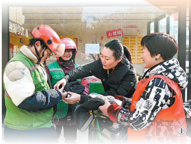
图①:浙江省金华经济技术开发区党员志愿者为外卖配送员送防寒物资。

加强新兴领域党建工作,关键是“落”在作用发挥上,推进新兴领域各类群体融入城市治理。这些年,我一直关注上海人民城市建设。新就业群体以及一些公益性社会组织,都是人民城市建设者、美好生活享受者。很多辖区、街道强化党建引领基层治理,搭建功能平台,让小哥们有渠道反映诉求,也有载体发挥作用。这正是通过深入践行全过程人民民主的重要理念,不断扩大党在新兴领域的号召力凝聚力影响力。今后应沿着这条路继续走下去,支持党组织健全的社会组织有序承接政府转移职能和有关服务项目,实现行业党建与基层治理同频共振;持续发挥新就业群体的职业特点,让更多的党员小哥成为社区“管理员”、移动“网格员”,切实把党的组织优势转化为治理效能。