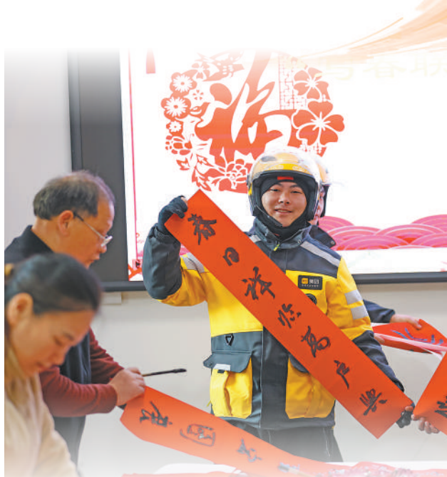
图②:山东省郯城县党员干部与外卖配送员一起写春联。