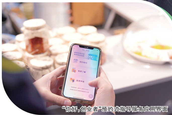
“你好，创业者”预约式指导服务应用界面

西湖区构建更优营商环境，不仅着力提高政府部门的响应效率，还努力为经营主体提供“心连心”的零距离服务。工作人员通过实地走访，深入了解创业者等各类经营主体的实际需求，让“你好，创业者”营商环