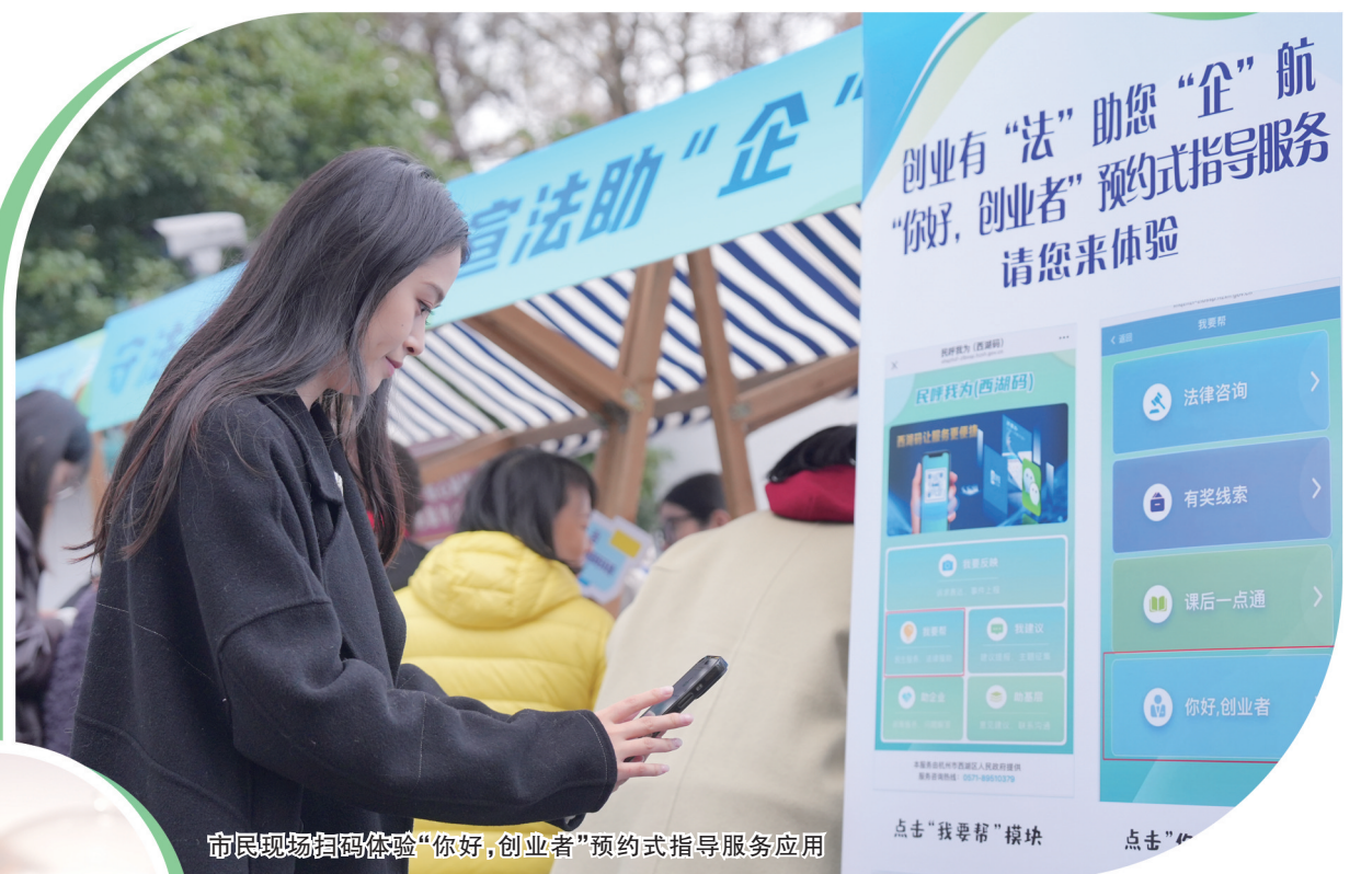
市民现场扫码体验“你好，创业者”预约式指导服务应用

管+公安+交警+机动支撑”多方力量快速响应、高效服务的新型工作格局……多样化的实景创新，让执法质效提升，实现与广大经营主体更加紧密的联动。