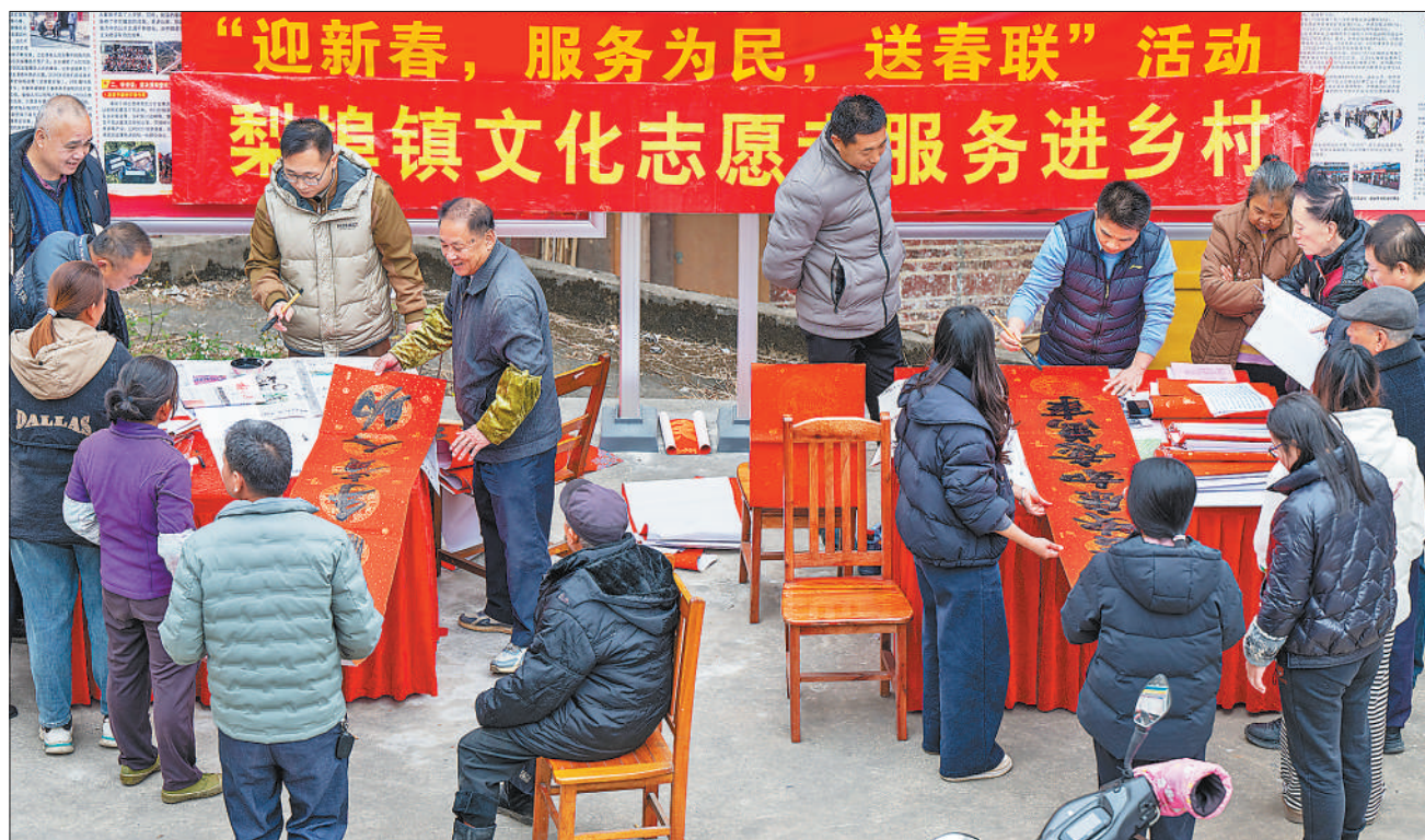
1月14日，广西梧州市苍梧县梨埠镇开展“迎新春，服务为民，送春联”文化志愿者服务进乡村活动，邀请当地书法家免费书写春联和“福”字赠送给群众。