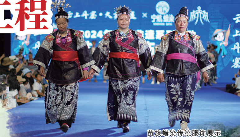
苗族蜡染传统服饰展示