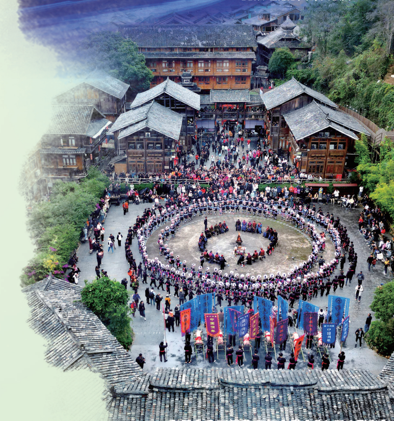
贵州省黎平县肇兴侗寨举办“六月六”活动