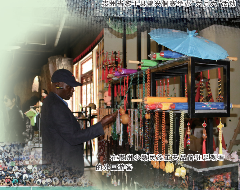
在贵州少数民族工艺品前驻足观看的外国游客