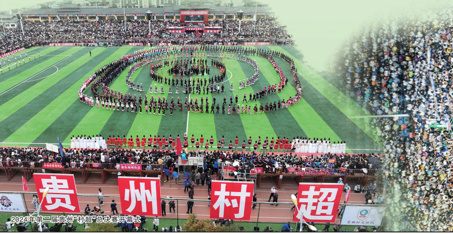
2024年第三届贵州“村超”总决赛开幕式