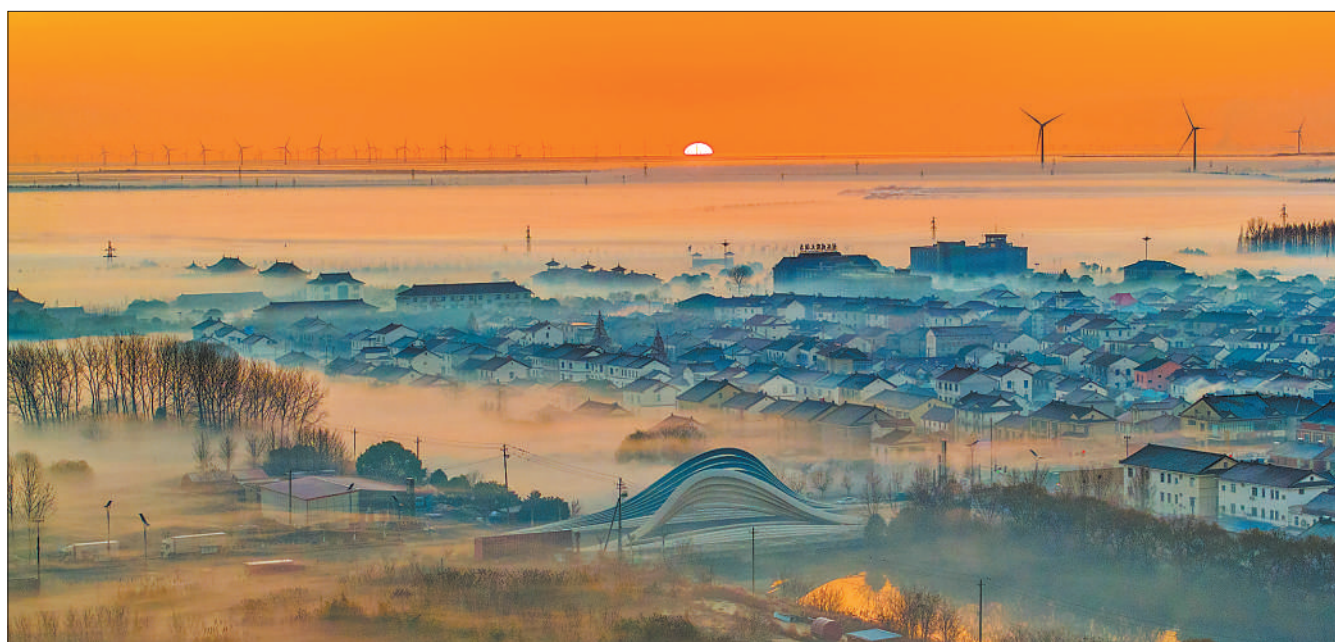
1月2日清晨,江苏东台市琼港镇,错落有致的街区、民居在晨雾中若隐若现,如一幅水彩画。琼港镇位于黄海之滨,近年来,该镇不断推进集镇建设、产业发展、环境治理,绿色发展成效显著。图为琼港镇景色。

为防止执行程序空转,《指导意见》明确,人民法院应当及时、规范采取财产保全、查封、处置和案款发放等措施,对有财产可供执行的,依法处置变现并及时给付;对恶意拖延执行、虚假提起执行异议等滥用执行异议权的,应当依据民事诉讼法的规定,采取强制措施。