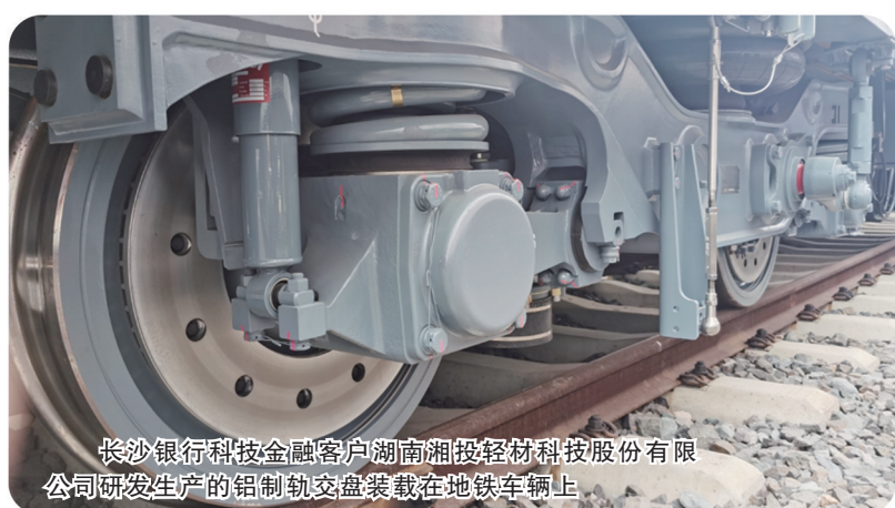
长沙银行科技金融客户湖南湘投轻材科技股份有限公司研发生产的铝制轨道交通盘安装在地铁车辆上