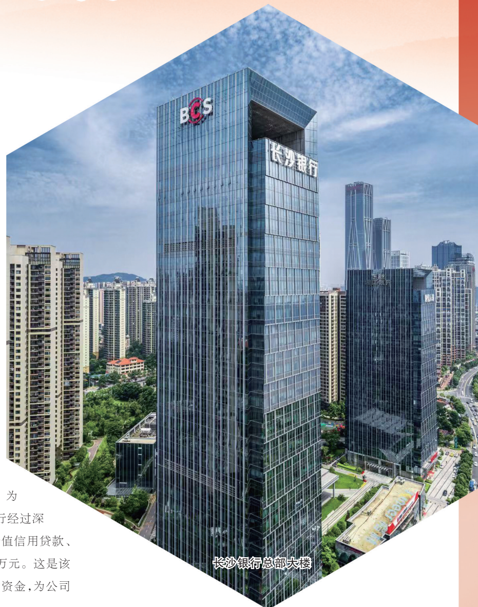
长沙银行总部大楼

据长沙银行2024年第三季度报告，长沙银行资产总额11231.34亿元，较年初增长10.11%；吸收存款本息总额6886.95亿元，较年初增长4.53%；发放贷款及垫款本息总额5432.30亿元，较年初增长11.23%。2024年前三季度，实现营业收入194.71亿元，同比增长3.83%；归母净利润61.87亿元，同比增长5.85%。