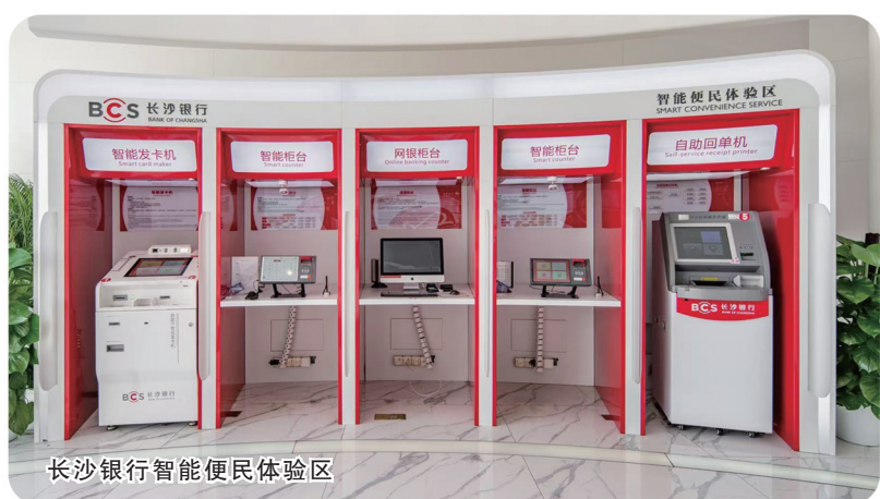
长沙银行智能便民体验区