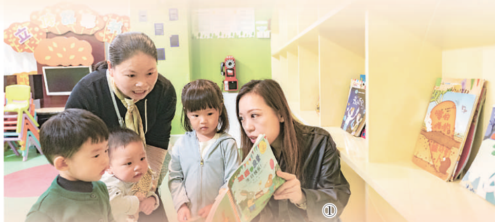
图①:长宁区虹桥街道古北市民中心工作人员在给小朋友讲故事。

——设立片区网格,建立健全五级网格组织体系。针对有些治理难题街镇“摸不到”、社区“管不了”,上海根据空间相邻、面积均衡、特点相似等标准,在街镇与居民区之间搭建片区网格。部分街镇通过设立片区党委或功能性党支部,进一步加强党对片区网格的领导,逐步形成“街镇党工委—片区网格党