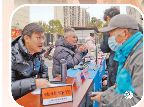
图②:宝山区新顾城大居拓展区联合党支部开展便民服务项目。图为工作人员为居民提供法律咨询。