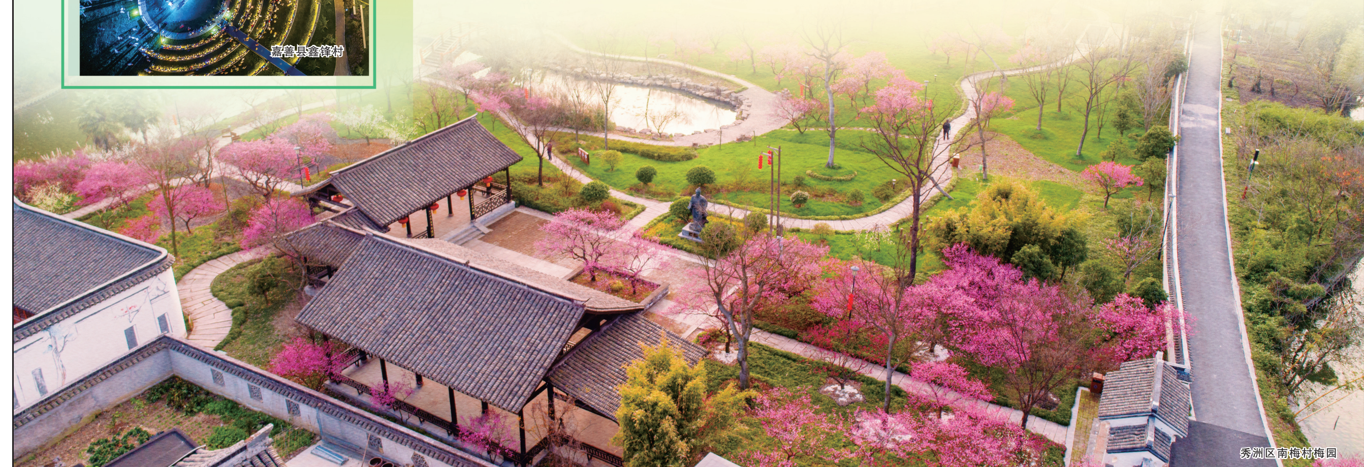
秀洲区南梅村梅园