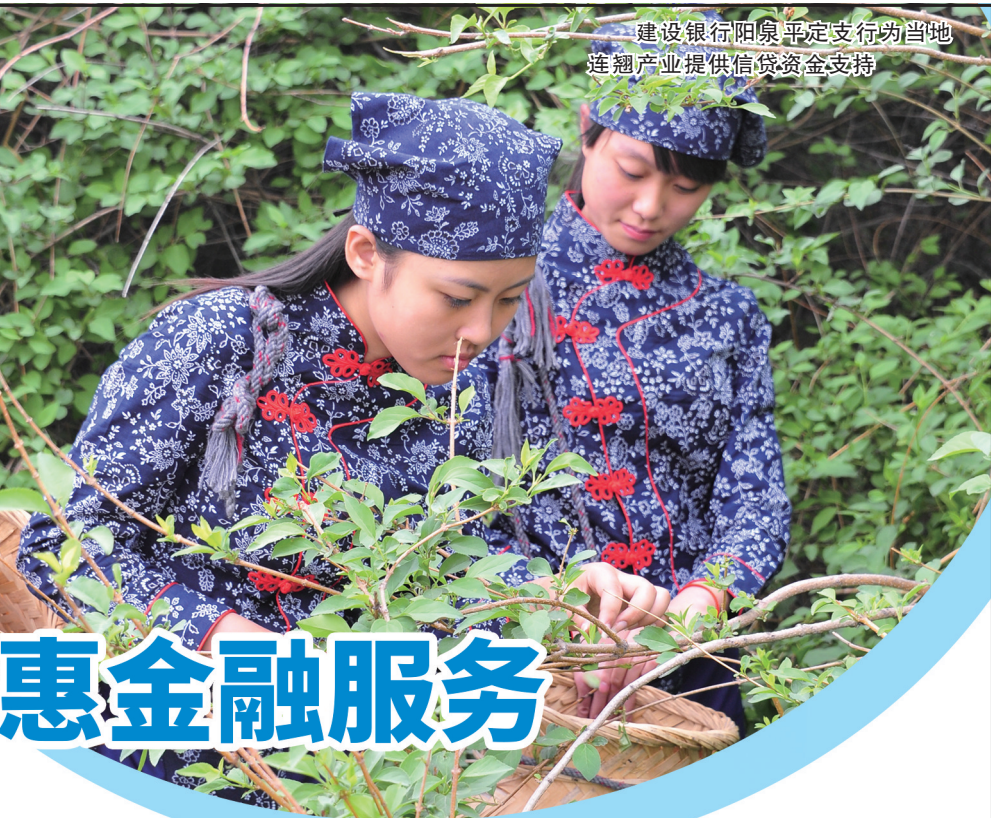
建设银行阳泉平定支行当地连翘产业提供信贷资金支持