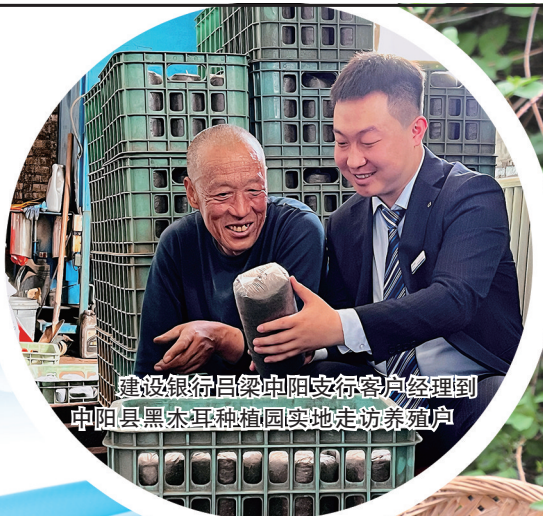
建设银行吕梁中阳支行客户经理到中阳县黑木耳种植园实地走访养殖户

为加大金融服务实体经济力度，建设银行山西省分行坚守主责主业，加快推进支持小微企业融资协调工作机制相关工作，加大普惠金融供给，为小微企业、涉农经营主体及重点帮扶群体注入源源不断的金融动力，满足其多样化金融需求。