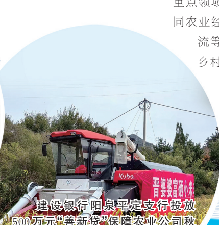
建设银行阳泉平定支行投放500万元“善新贷”保障农业公司秋粮收购