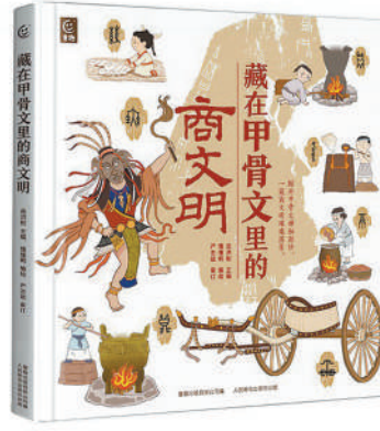
《藏在甲骨文里的商文明》：岳洪彬主编，童趣出版有限公司编；人民邮电出版社出版。