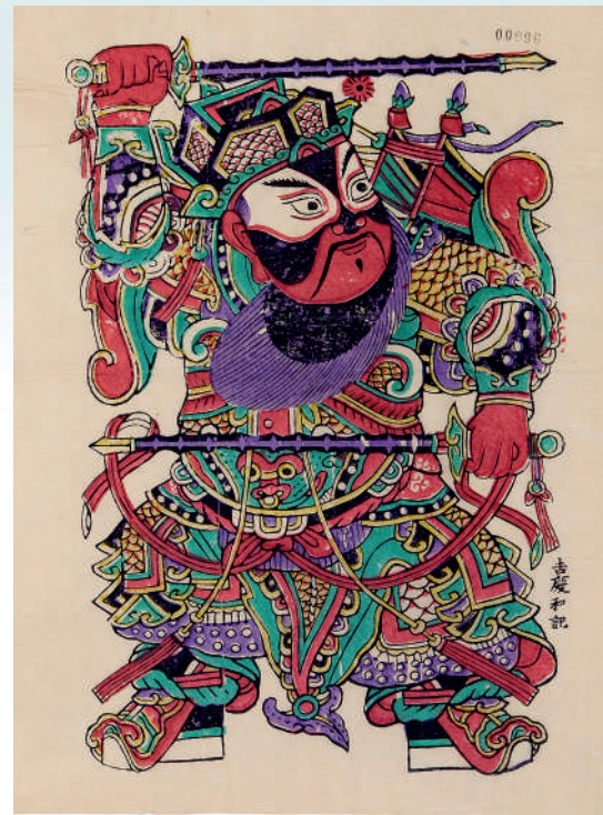
《尉迟恭门画》(清)，木版套印，纵31.5厘米，横21.5厘米，河北武强，中国国家图书馆藏。选自《中国年画史》。

(作者为中央美术学院已故教授薄松年。《中国年画史》，薄松年著；湖北美术出版社出版。本书入选2024年8月“中国好书”推荐书目，本文为该书绪论，本版有删节，标题为编者所加。)