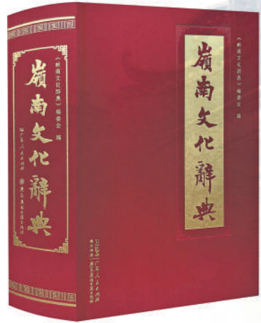
《岭南文化辞典》，本书编委会编；广东人民出版社、广东岭南古籍出版社出版。

《岭南文化辞典》首先是一部岭南文化知识的集大成，编者较为充分地兑现了他们的学术承诺。但编者的立意并未止于此，比如，地理卷中的词条“韩山”，不足百字，不仅解释了“韩山”改名的历史与文化因由，并通过陈述韩愈对岭南文化繁衍生长的独特贡献，精确传达岭南文化与中原文化之间的深远互动，破除人们把岭南文化习惯性视为“边缘文化”的思维定势。