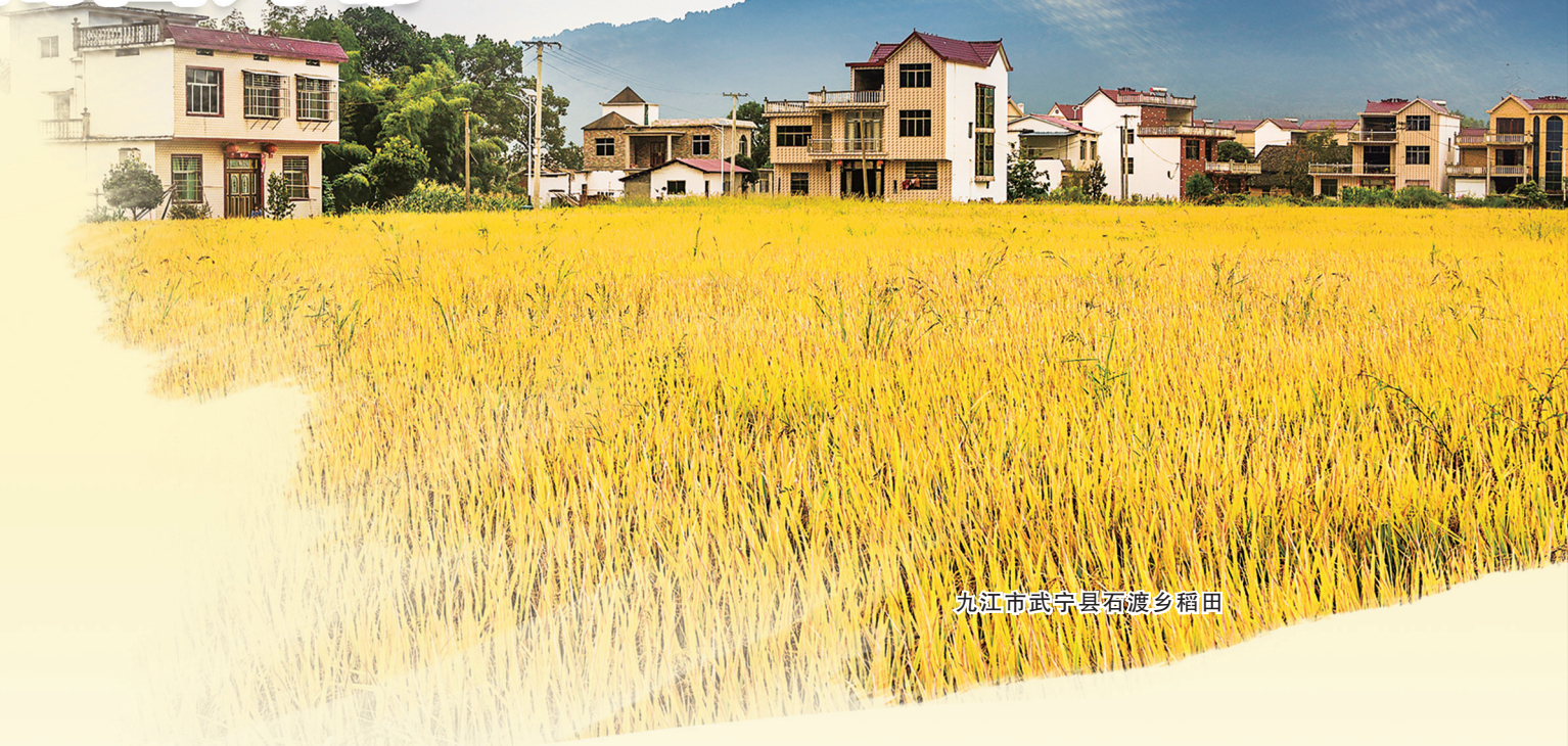
九江市武宁县石渡乡稻田