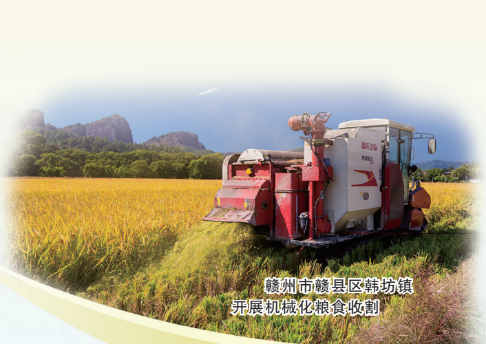
赣州市赣县区韩坊镇 开展机械化粮食收割