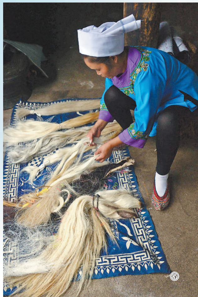
图⑤：三都县水族马尾绣绣娘挑选马尾。