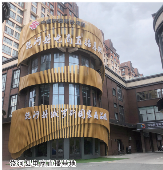
饶河县电商直播基地