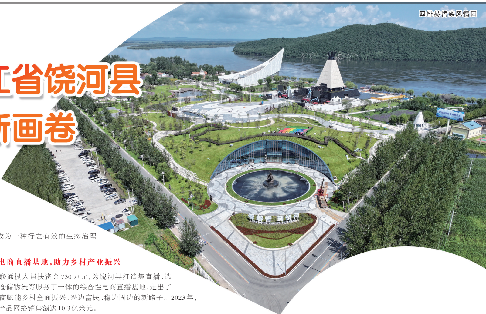
四排赫哲族风情园