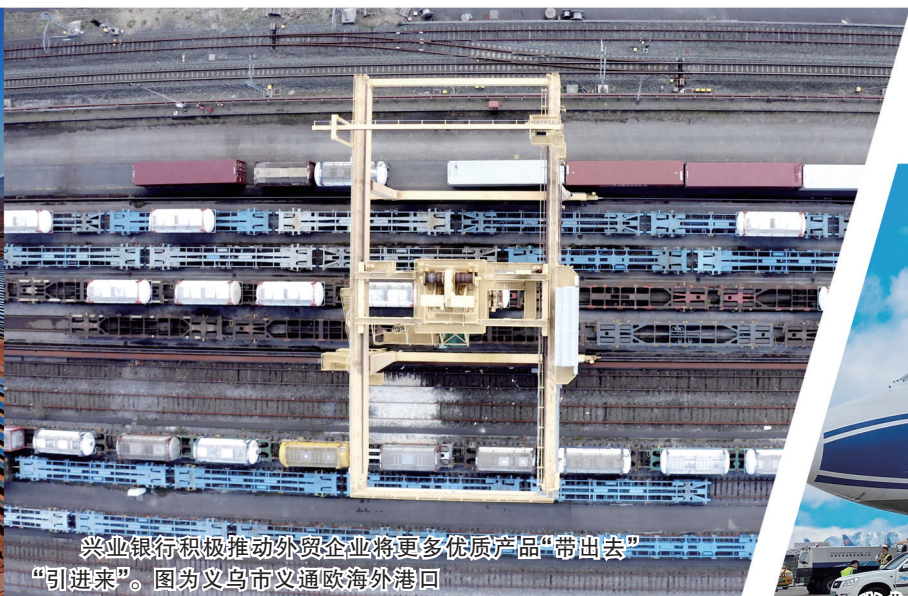
兴业银行积极推动外贸企业将更多优质产品“带出去”“引进来”。图为义乌市义通海外港口