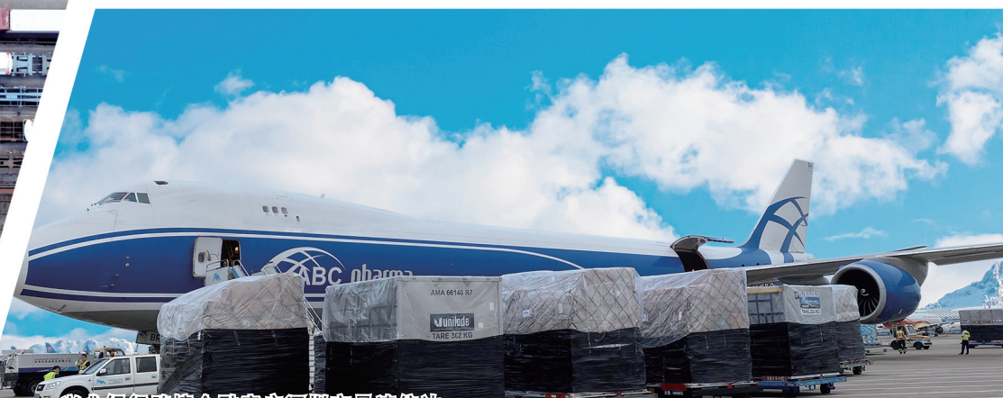
兴业银行跨境金融客户深圳市易速信达供应链有限公司的航空物流专线