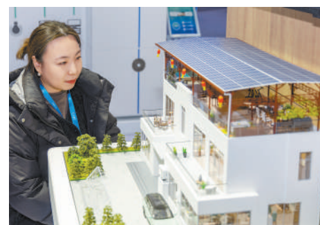
观众在参观新能源应用场景模型。