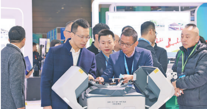
观众了解“能源+低空经济”应用场景。