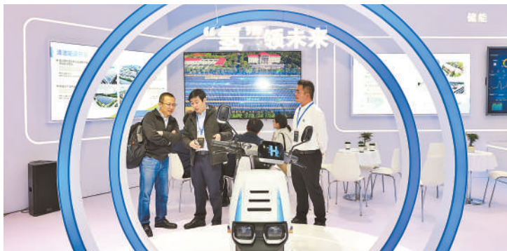
展览会上展出的氢能电动车。