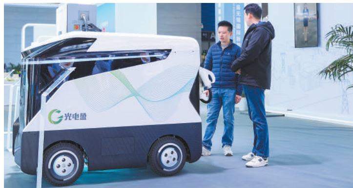
观众参观移动式储能充电机器人。