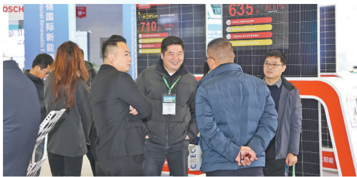
光伏行业参展商与专业观众交流商讨。