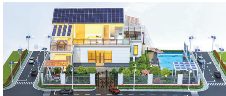
▲新能源智能家居模型。 敖 翔摄(人民视觉) ▲展览会上展出的移动储能充电机器人。 敖 翔摄(人民视觉)