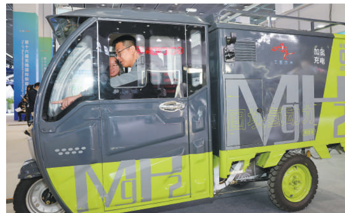
观众在试乘氢能快递专用车。