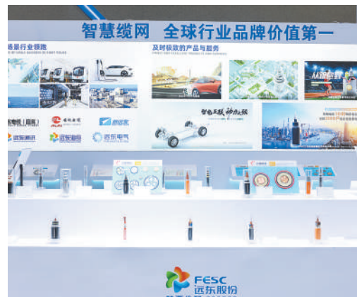
电缆行业新能源应用零件装备展台。