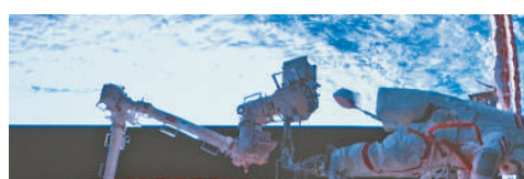
左图:航天员蔡旭哲在空间站组合体舱外工作的画面。