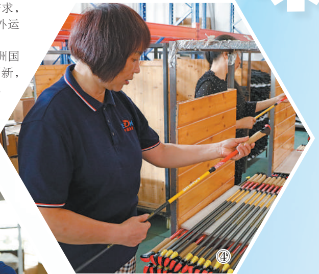
中国冰雪装备器材相关企业