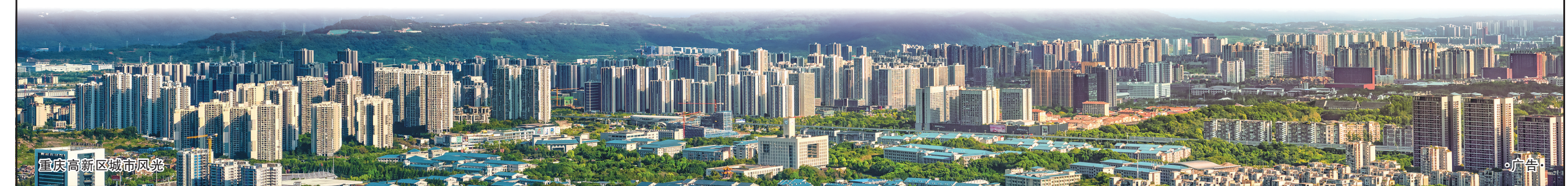
重庆高新区城市风光