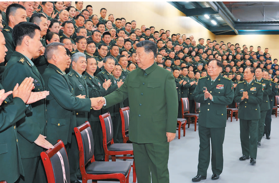
十二月四日,中共中央总书记、国家主席、中央军委主席习近平在视察信息支援部队,代表党中央和中央军委,对信息支援部队第一次党代表大会的召开表示热烈祝贺,向信息支援部队全体官兵致以诚挚问候。这是习近平同代表们亲切握手。