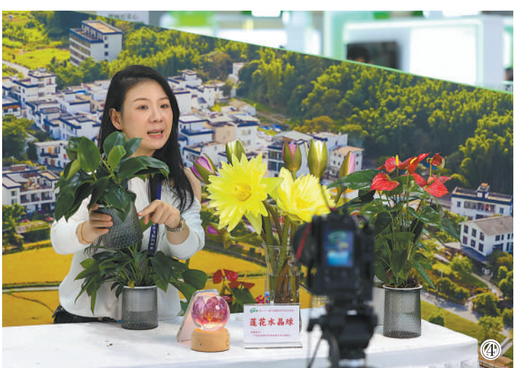
图①:6株不同生长阶段的增城迟菜心,串联起生长全过程。 图②:高产水稻新品种“19香”。 图③:广东馆茂名展区展出的特色鱼类品种。 图④:展位的工作人员在直播推介花卉盆栽。 图⑤:中国电信展台前,工作人员向客商介绍保障农产品质量安全的区块链技术。 图⑥:一家科技公司展出的田间作物表型巡检机器人。 图⑦:参观者体验通过5G技术远程操控拖拉机进行田间作业。