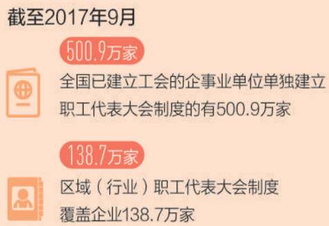
本版制图：蔡华伟 汪哲平