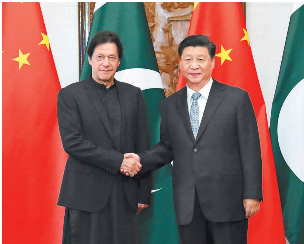
10月9日,国家主席习近平在北京钓鱼台国宾馆会见巴基斯坦总理伊姆兰·汗。

本报北京10月9日电 (记者王远)国家主席习近平9日在钓鱼台国宾馆会见巴基斯坦总理伊姆兰·汗。