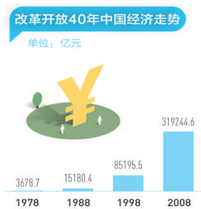
改革开放40年中国经济走势

党的十一届三中全会是在党和国家面临何去何从的重大历史关头召开的。当时，世界经济快速发展，科技进步日新月异，