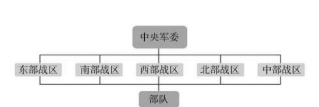
图2 军队作战指挥体系架构图

建立健全联合作战指挥体制。健全军委联合作战指挥机构，组建战区联合作战指挥机构，形成平战一体、常态运行、专司主营、精干高效的联合作战指挥体系。撤销沈阳、北京、兰州、济南、南京、广州、成都7大军区，成立东部、南部、西部、北部、中部5个战区。通过改革，构建起“中央军委—战区—部队”的作战指挥体系。