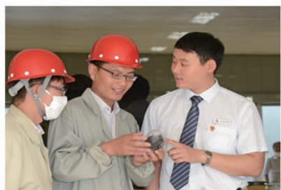
中行徐州分行客户经理在江苏新春兴公司开展调研

从“一城煤灰半城土”到“一城青山半城湖”,资源型城市、老工业基地——江苏省徐州市实现了绿色发展。而在徐州的绿色转型过程中,金融力量的支撑功不可没。