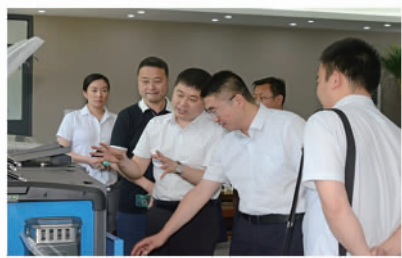
中行江苏省分行领导走访万德福公司