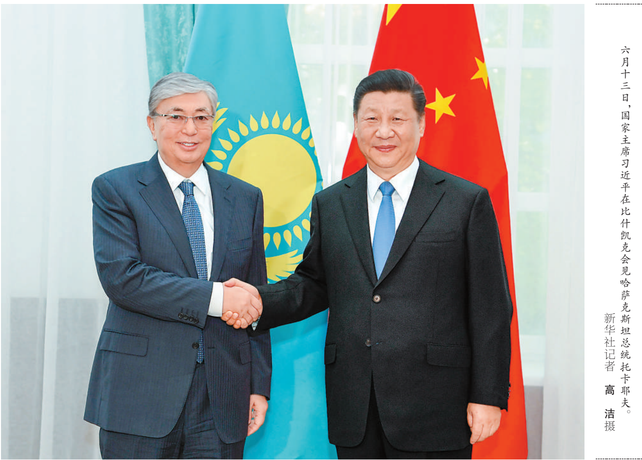
六月十三日，国家主席习近平在比什凯克会见哈萨克斯坦总统托卡耶夫。

本报比什凯克6月13日电 （记者曲颂、刘文波）国家主席习近平13日在比什凯克会见阿富汗总统加尼。习近平祝贺阿富汗独立100周年，祝愿阿富汗早日实现和平、稳定、发展。习近平指出，中阿是传统友好邻邦和战略合作伙伴。中方愿同阿方在共建“一带一路”框架内，不断深化两国各领域互利合作，稳步推进经贸务实合作项目，支持两国企业本着互利共赢原则加强合作。中方将一如既往地帮助阿富汗加强反恐维稳能力建设，希望阿方继续坚定支持中方打击“东伊运”恐怖势力。习近平强调，中方支持“阿人主导，阿人所有”的广泛包容和解进程，将继续通过各种渠道，积极劝和促谈，帮助阿