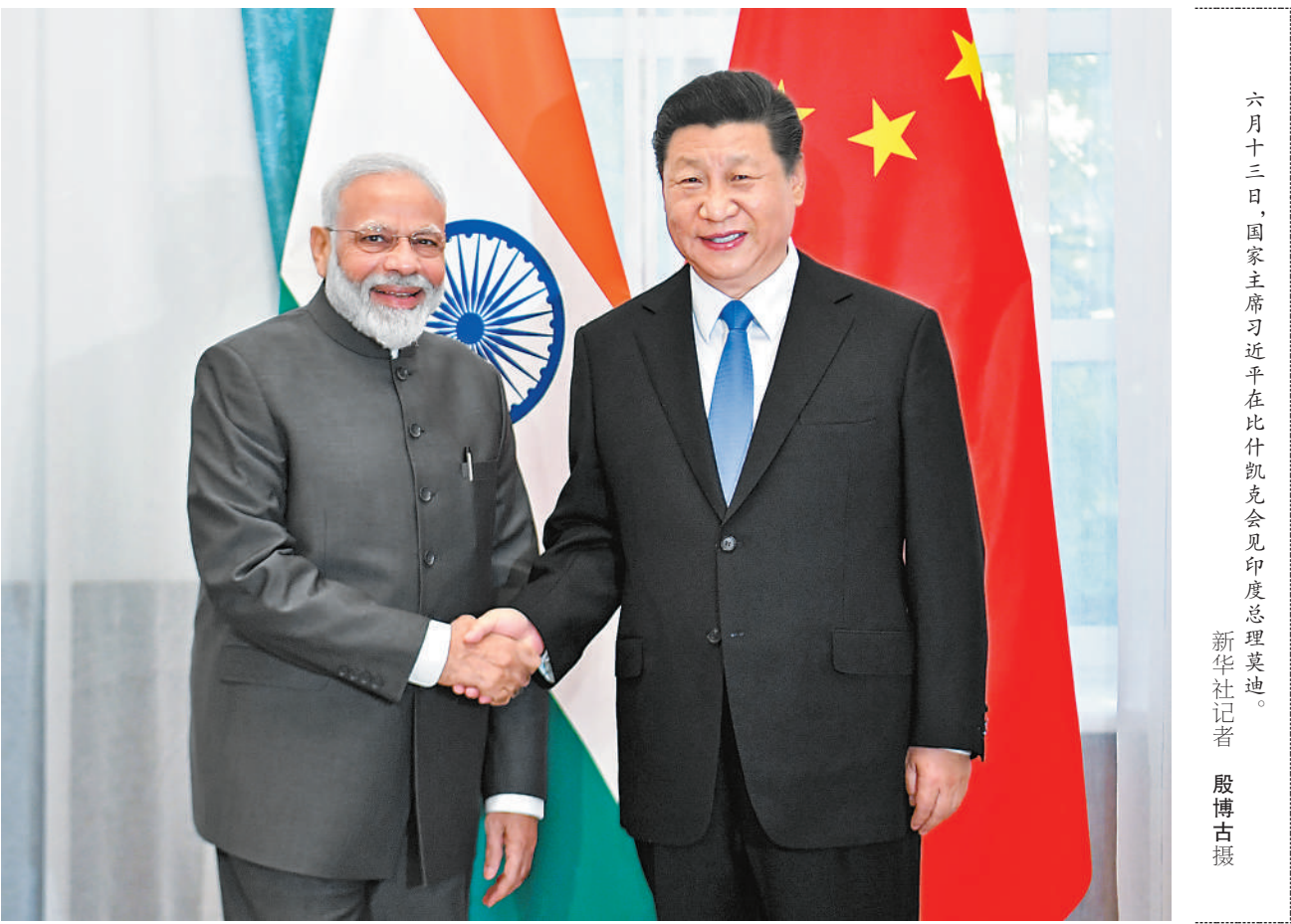
六月十三日，国家主席习近平在比什凯克会见印度总理莫迪。

本报比什凯克6月13日电 （记者杜尚泽、肖新新）国家主席习近平13日在比什凯克会见印度总理莫迪。习近平再次祝贺莫迪连任印度总理。习近平指出，中印是世界上仅有的两个10亿人口级别的新兴市场国家，都处在快速发展的重要阶段。中印两国携手合作，不仅能助力彼此发展，而且将为亚洲乃至世界和平、稳定、繁荣贡献力量。我同总理先生去年在武汉举行会晤，引领中印关系进入新阶段。中方愿同印方一道努力，持续推进中印更加紧密的发展伙伴关系。习近平强调，双方要坚持中印互为发展机遇、互不构成威胁的基本判断，坚持深化互信、聚焦合作、妥善处理分歧，使中印关系成为促进两国发展的更大正能量。要不断拓展合作渠道，开展投资、产能、旅游等方面合作，做大共同利益蛋糕，共同推动区域互联互通，包括孟中印缅经济走廊建设，更好实现合作发展、共同发展。要用好边界问题特别代表会晤等机制，加强信任措施建设，保持两国边境地区的稳定。作为发展中国家和新兴市场经济体的重要代表，中印双方要共同维护自由贸易和多边主义，维护发展中国家正当发展权利。莫迪表示，感谢习近平主席再次祝贺我连任印度总理。去年我同习主席在武汉的会晤非常成功，推动印中关系得到新的发展。印方愿同中方密切高层交往，加强战略沟通，在广泛领域推进双边关系，拓展两国合作新领域，妥善处理两国间分歧。印中双方要共同规划好明年两国建交70周年纪念活动，增进两国人文交流。丁薛祥、杨洁篪、王毅、何立峰等参加会见。