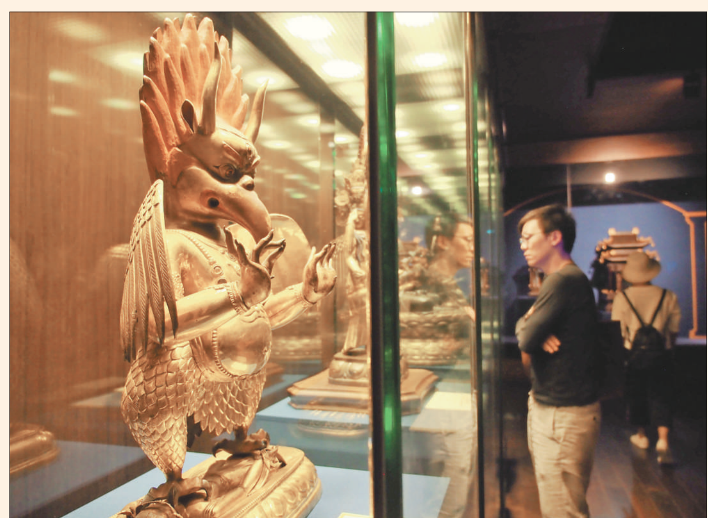
本报北京5月28日电(记者王珏)5月28日至7月14日,故宫博物院与梵蒂冈博物馆合作,在故宫神武门展厅联合举办“传心之美——梵蒂冈博物馆藏中国文物展”,首次将梵蒂冈博物馆收藏的中国文物带回中国展出。展览从梵蒂冈博物馆的藏品中精选出78件展品,涵盖天主教艺术、佛教艺术和世俗艺术3个方面,还特意选择了表现同一主题的油画与中国画对应展出,印证了中梵之间历史文化的交融与交流。

本报沈阳5月28日电(记者何勇)1200套不同风格的旗袍一一呈现,融汇了苏绣、满绣、绘画、古诗词等中国传统文化元素……5月24至31日,首届中国旗袍文化节在沈阳故宫举办,让市民和游客体验到了传统文化与时尚的交汇之美。首届中国旗袍文化节由中国民间文艺家协会、沈阳市委宣传部主办,历时8天。其间,将举行旗袍文化论坛、旗袍定制艺术大赏、清代宫廷旗袍展、盛京满绣非遗推广等10多项异彩纷呈的主题活动,还将举办30余项文化交流活动,通过一系列旗袍展演、评选“中国满绣最美绣娘”等活动,挖掘推广旗袍文化,引领旗袍创意产业发展。