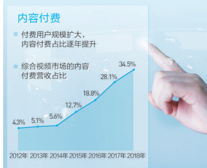
数据来源:《2019中国网络视听发展研究报告》

正在成都举办的第七届中国网络视听大会上,中国网络视听节目服务协会发布了《2019中国网络视听发展研究报告》。大会期间,短视频成为行业关注的热点。报告显示,短视频的发展速度惊人,2018年我国网络视频(含短视频)用户达7.25亿,网络视频(含短视频)是中国第二大互联网应用,仅次于即时通讯,市场规模达1871.3亿元,其中短视频市场规模467.1亿元,同比增长744.7%。但同时,在自身内容品质、版权保护等方面,短视频也面临着种种复杂的问题。