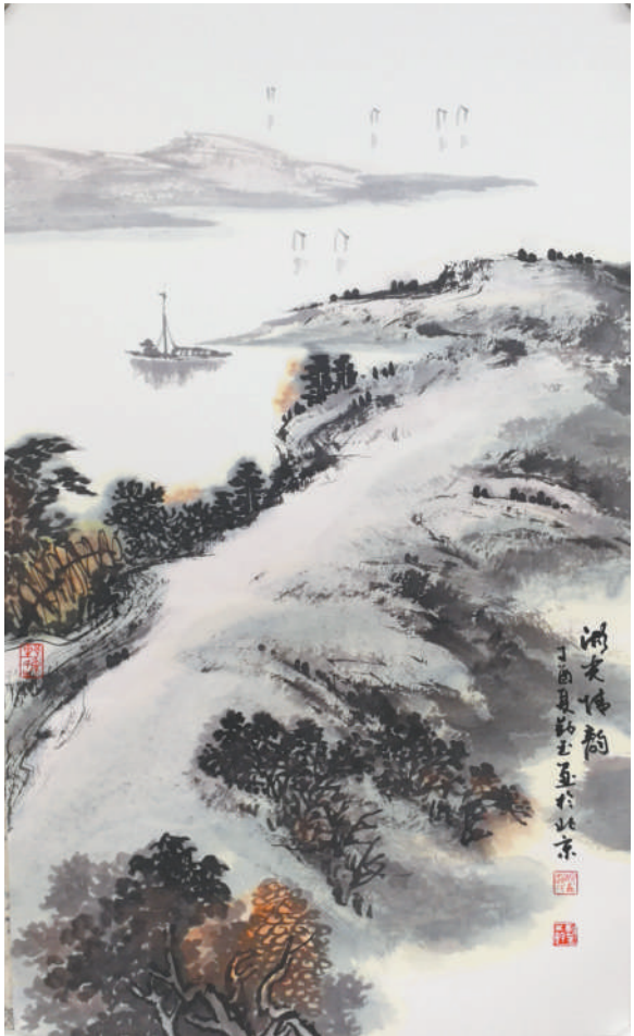
湖光情韵(中国画) 赵勤玉