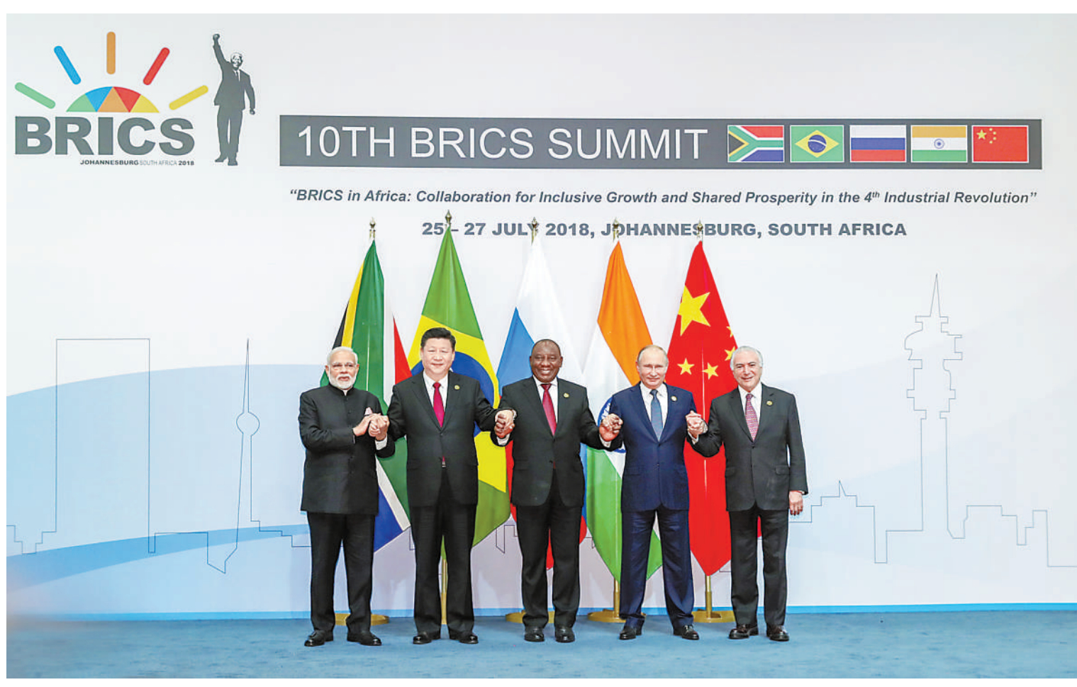
7月26日,金砖国家领导人第十次会晤在南非约翰内斯堡举行。南非总统拉马福萨主持。中国国家主席习近平、巴西总统特梅尔、俄罗斯总统普京、印度总理莫迪出席。这是五国领导人合影。

本报约翰内斯堡7月26日电 (记者汪晓东、杜尚泽、李志伟)金砖国家领导人第十次会晤26日在南非约翰内斯堡举行。南非总统拉马福萨主持。中国国家主席习近平、巴西总统特梅尔、俄罗斯总统普京、印度总理莫迪出席。五国领导人围绕“金砖国家在非洲:在第四次工业革命中共谋包容增长和共同繁荣”主题,就金砖国家合作及共同关心的重大国际问题深入交换看法,达成广泛共识。 习近平发表了题为《让美好愿景变为现实》的重要讲话,揭示新工业革命突出特点,就金砖合作未来发展提出倡议,强调金砖国家要携手努力,共同推动建设持久和平、普遍安全、共同繁荣、开放包容、清洁美丽的世界。 习近平指出,18世纪以来三次工业革命颠覆性的科技革新,带来社会生产力的大解放和生活水平的大跃升,从根本上改变了人类历史发展轨迹。如今,我们正在经历一场更大范围、更深层次的科技革命和产业变革。新技术、新业态、新产业层出不穷,各国利益和命运紧密相连,深度交融。同时,世界经济深层次、结构性问题和地缘政治冲突、保护主义、单边主义直接影响到新兴市场国家和发展中国家发展的外部环境。