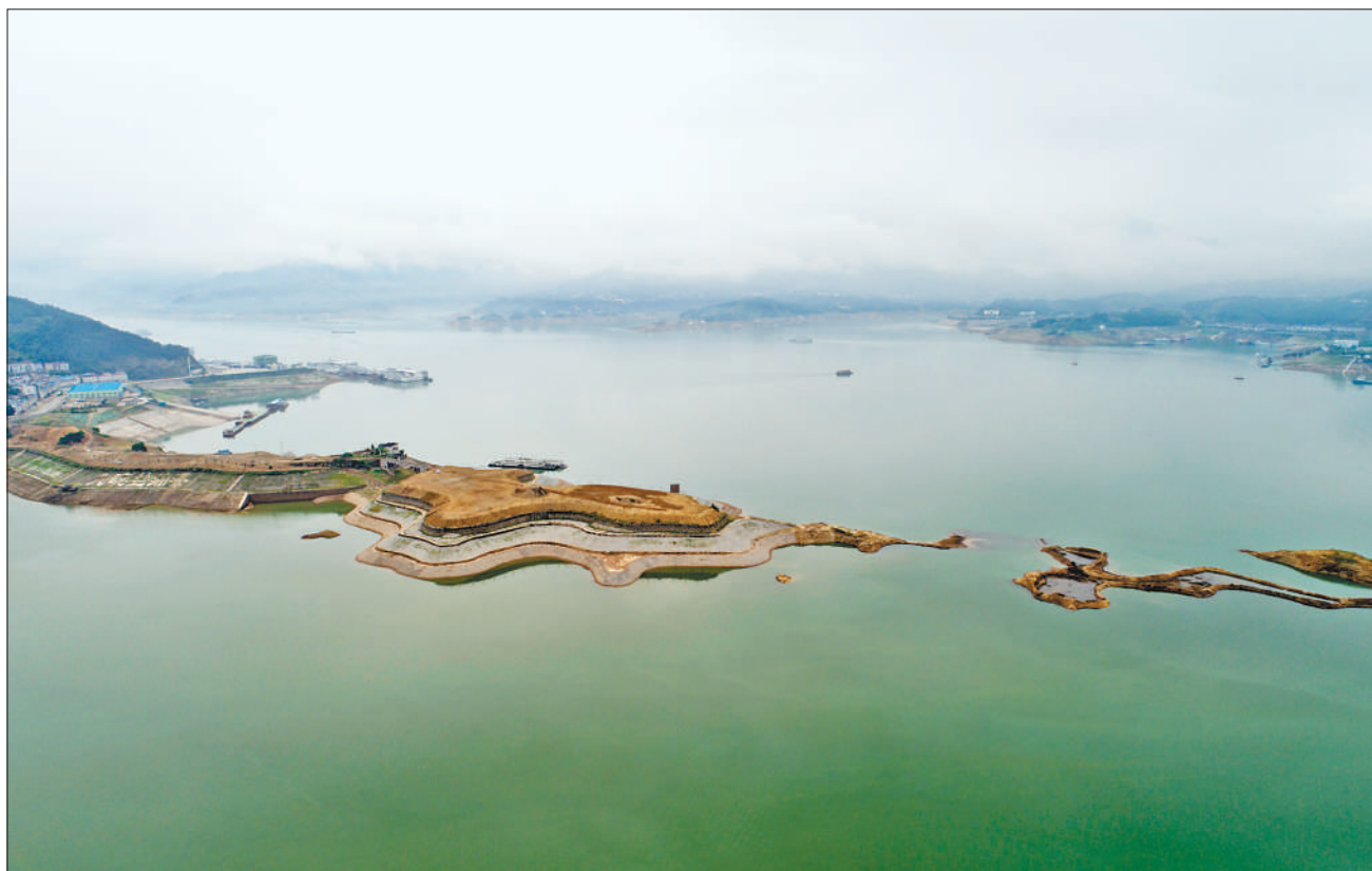
三峡水库 启动生态调度试验

生态文明建设功在当代、利在千秋。紧密团结在以习近平同志为核心的党中央周围,充分发挥党的领导和我国社会主义制度能够集中力量办大事的政治优势,加大力度推进生态文明建设,解决生态环境问题,我们就一定能推动形成人与自然和谐发展的现代化建设新格局,让中华大地天更蓝、山更绿、水更清、环境更优美。