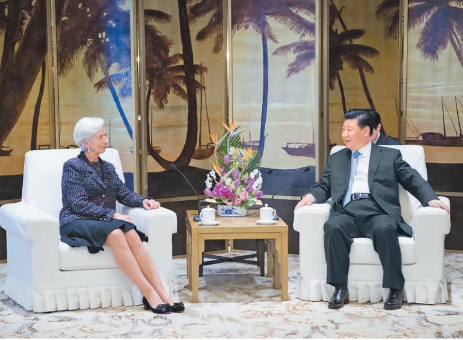
4月10日，国家主席习近平在海南省博鳌国宾馆会见国际货币基金组织总裁拉加德。

增长、维护金融稳定作出的重要贡献，肯定国际货币基金组织实施的份额和治理改革，增加发展中国家和新兴市场国家代表性和发言权，赞赏国际货币基金组织对中国和亚洲发展的关心、对“一带一路”倡议的支持。