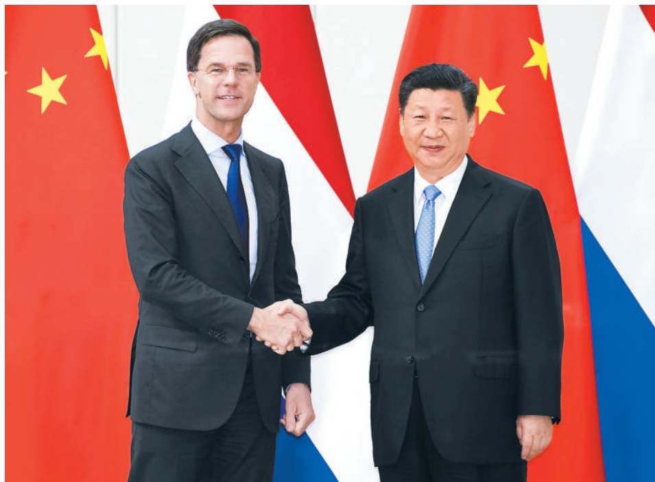
4月10日，国家主席习近平在海南省博鳌国宾馆会见荷兰首相吕特。

重要演讲。荷中关系强劲且重要，荷方期待深化两国合作，共同打造共建“一带一路”伙伴关系，实现互利共赢。荷方重视中方在国际事务中的重要作用，支持自由贸易，致力于推动加强欧中关系。