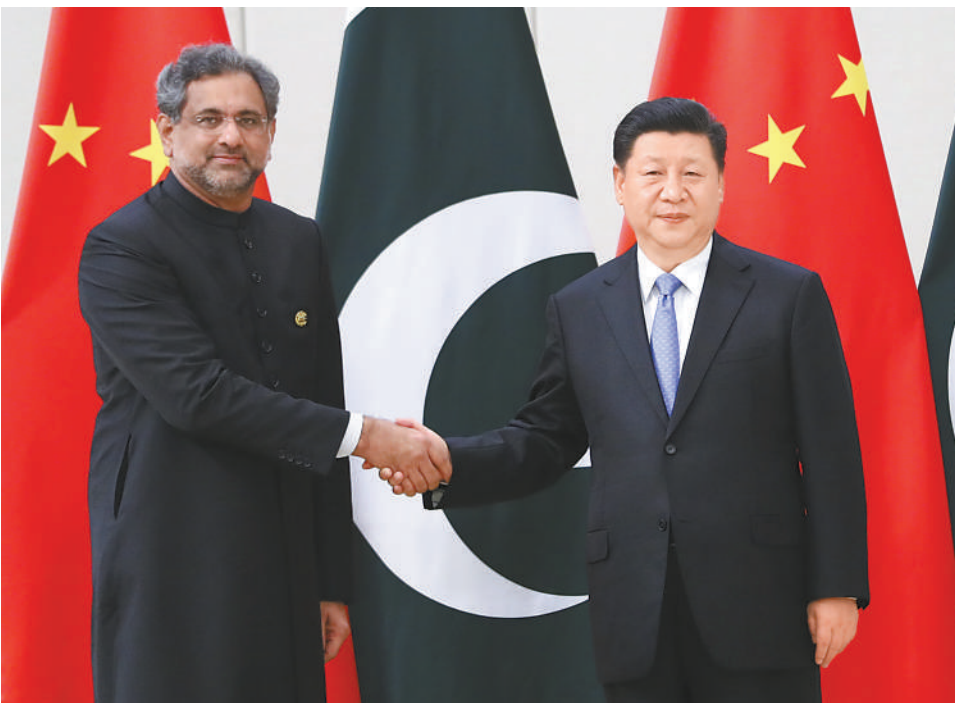
4月10日，国家主席习近平在海南省博鳌国宾馆会见巴基斯坦总理阿巴西。

具有更加重要和现实意义。中巴关系应当成为睦邻友好的典范、地区和平稳定的支柱、“一带一路”国际合作的标杆。中方愿同巴方一道，发挥高层交往对双边关系的重要引领作用，保持各领域密切交流，弘扬传统友好，继续相互支持，深化利益融合，推动中巴关系实现更高水平发展，打造更加紧密的中巴命运共同体。双方要继续稳步推进中巴经济走廊建设，规划和实施好瓜达尔港等基础设施、能源、产业园区等项目。