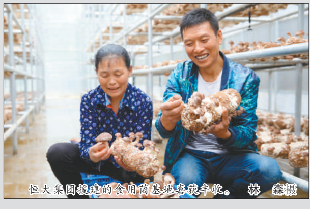
恒大集团援建的食用菌基地喜获丰收。

恒大的“政企合力整体脱贫攻坚”模式入选《扶贫蓝皮书：中国扶贫开发报告（2017）》。