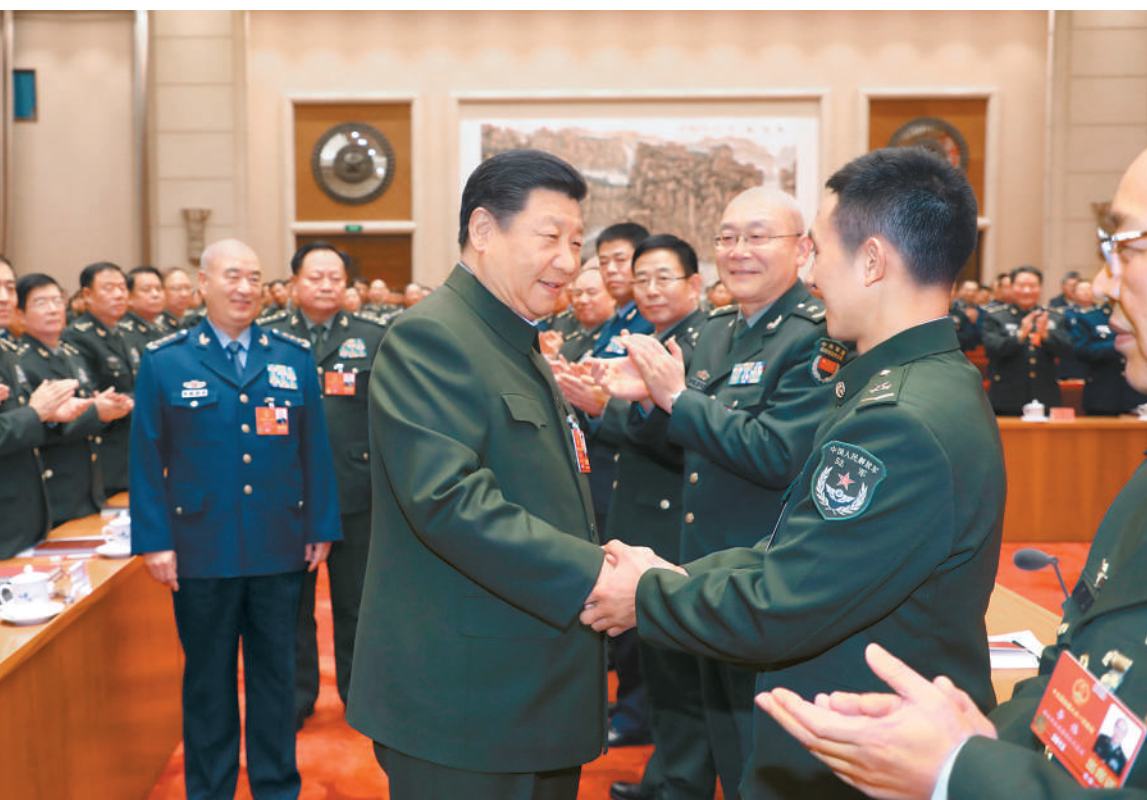
三月十二日上午,中共中央总书记、国家主席、中央军委主席习近平在出席十三届全国人大一次会议解放军和武警部队代表团全体会议时,与代表们亲切握手并合影留念。

新华社北京3月12日电 (记者李宜良、梅世雄)中共中央总书记、国家主席、中央军委主席习近平12日上午在出席十三届全国人大一次会议解放军和武警部队代表团全体会议时强调,实施军民融合发展战略是构建一体化国家战略体系和能力的必然选择,也是实现党在新时代的强军目标的必然选择,要加强战略引领,加强改革创新,加强军地协同,加强任务落实,努力开创新时代军民融合深度发展新局面,为实现中国梦强军梦提供强大动力和战略支撑。