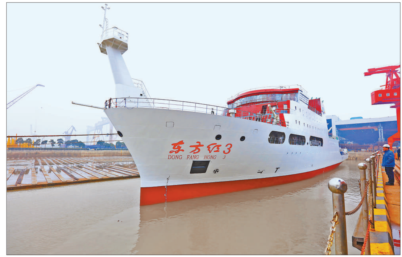
近日,新型深潜载人潜水器“东方红3”在上海下水。该船是“东方红”系列科学考察船第三艘,它的建造标志着我国的科考船已迈进世界一流船型行列。图为1月17日系泊在港池的“东方红3”。

本报西宁1月18日电 (记者王锦涛)18日,记者从三江源国家公园管理局了解到,经国务院批准,国家发展改革委正式对外公布《三江源国家公园总体规划》,明确至2020年正式设立三江源国家公园。 规划明确,近期目标是至2020年正式设立三江源国家公园,国家公园体制全面建立,绿色发展方式成为主体,基本建成青藏高原生态保护修复示范区,共建共享、人与自然和谐共生的先行区,青藏高原大自然保护展示和生态文化传承区;中期目标是到2025年,形成独具特色的国家公园服务、管理和科研体系;远期目标是到2035年,届时三江源国家公园将成为生态保护典范,体制机制创新典范,我国国家公园典范,建成现代化国家公园。 作为我国第一个国家公园体制试点,三江源国家公园将破解“九龙治水”体制机制藩篱,筑牢国家生态安全屏障。