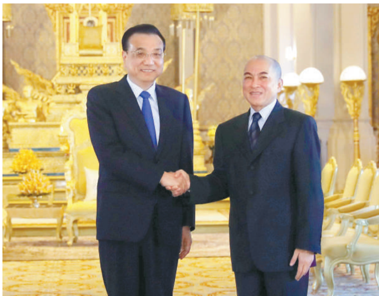
1月11日,国务院总理李克强在金边王宫会见柬埔寨国王西哈莫尼。