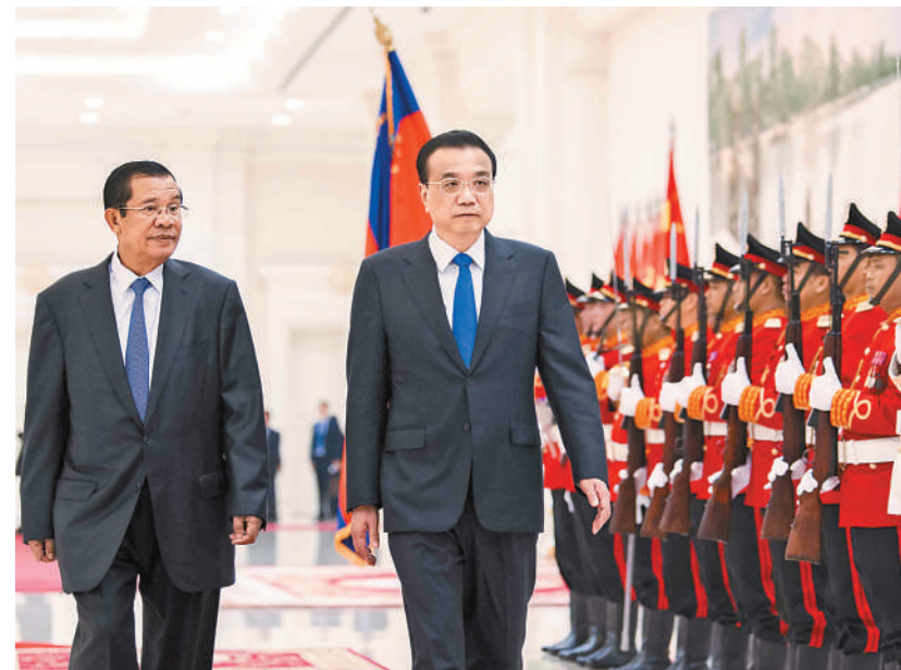
1月11日,国务院总理李克强在金边和平大厦同柬埔寨首相洪森举行会谈。这是会谈前,洪森在和平大厦为李克强举行隆重的欢迎仪式。

洪森欢迎李克强总理在柬建交60周年之际访柬,并表示,李总理此访必将进一步巩固中柬传统友谊,推动两国全面战略合作伙伴关系和澜湄合作更上一层楼。中国是柬埔寨的友好合作伙伴,双方政治上高度互信,各领域务实合作活跃,人民间传统友谊深厚,柬方感谢中方长期以来对柬的坚定支持和